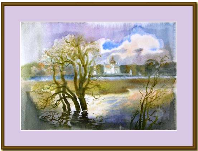
Рэпрадукцыя акварэлі Фёдара Кісялёва “Вясна ў Падніколлі”