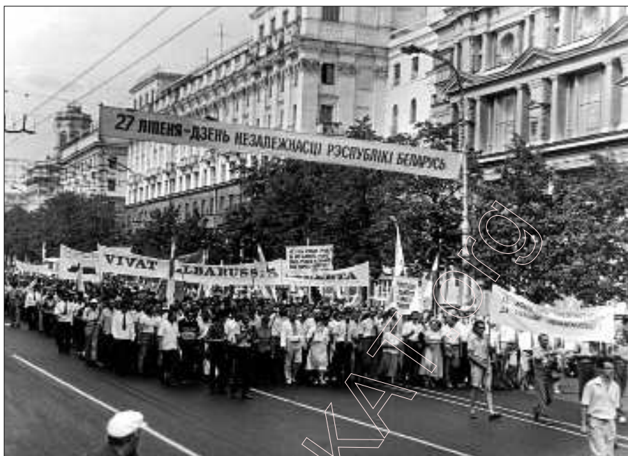
27 ліпеня 1992 г. у Менску.

толькі палітычным шляхам пры выкананні двух умоваў: дзяржаўны суверэннітэт і дэмакратычная ўлада. Канфэрэнцыя прыняла праект Дэкларацыі аб незалежнасці Беларусі, які пазьней дэпутаты БНФ прадставілі ў Вярхоўны Савет.