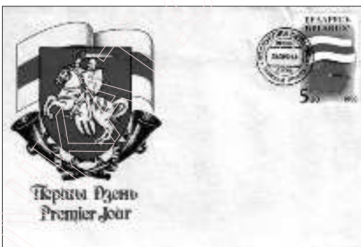
Новыя маркі Рэспублікі Беларусь. 1992 г.

Канешне, сярод дробных прадпрымальнікаў былі і нацыянальна сьвядомыя, але, як правіла, гэта былі людзі з зусім сьціплымі „капіталамі”, якіх, да прыкладу, не хапіла б на выпуск уласнай газэты. Толькі ўладальнікі кампютарнай фірмы „Дайнова” падкрэсьлена дапамагалі беларускім