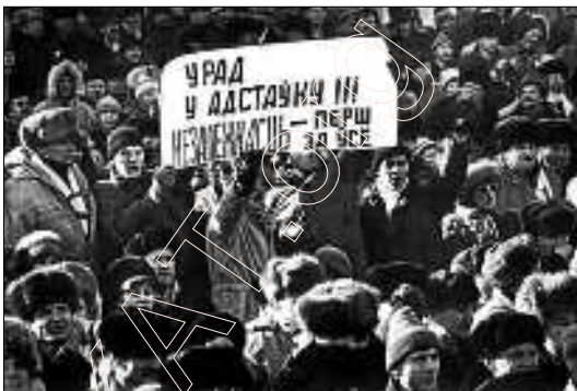
„Урад у адстаўку. Незалежнасьці!” 1991 г. Менск

апошнія ілюзіі зьніклі пасля кароткай размовы зь ім у лютым 1991 году пра дзеянні кіраўніцтва СССР падчас Чарнобылю. Генэральны сакратар ЦК КПСС і Прэзыдэнт ядзернай звышдзяржавы паводзіў сабе як вучань, які выправіў ацэнку ў дзёньніку. У той жа дзень, выступаючы ў Беларускай Акадэміі навук, Гарбачоў абрынуўся з рэзкімі выпадкамі на дэмакратаў; я сядзеў у