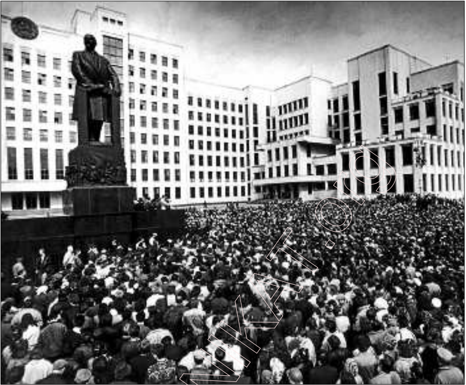
Красавік 1991 г. Рабочая дэманстрацыя каля Дому ўраду; першы дзень.

ўзяць накіраваньне ў адзін з урадавых санагорыяў, прычым за траціну кошту. Але ішла „барацьба з прывілеямі”, і для дэпутата Апазыцыі БНФ такое падавалася недапушчальным. У Крыме жылі ў трох ці чатырох месцах, у вельмі сьціплых пакойчыках, затое надвор’е было сонечным, мора цёплым, і гэта, фактычна, быў наш „мядовы месяц” – больш як праз год пасья вясельля, якое супала з выбарчай кампаніяй. Адноўчы, па дарозе ў Севастопаль, экскурсавод паказала новую дачу Гарбачова – усе кінуліся да вокнаў аўтобуса, але за кіпарысамі толькі на імгненне мільгануў чырвоны дах. Праз месяц пад ім адбыліся падзеі, якія кардынальна паўплывалі на лёс народаў Савецкага Саюза, у тым ліку і Беларусі.