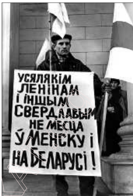
Канец камунізму ў Беларусі.

Так, пастановай Кабінэту Міністраў СССР ад 10 красавіка 1991 года і загадам старшыні КДБ СССР ад 17 красавіка таго ж году было