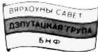
Значок дэпутацкай Фракцыі БНФ у Вярхоўным Савеце. 1990 г.

Пад час сустрэчы з нашымі калегамі з афіцыйнай дэлегацыі я адчуў нейкае насыцджанае да сябе стаўленьне з боку Ніла Гілевіча, ды, бадай, і іншых дэпутатаў – за выключэннем Валяціна Голубева. Праўда, з Лукашэнкам у мяне ніколі не было прыязных адносінаў, з некаторымі іншымі мы часам дэбатавалі на сесіях, і я не надаў гэтаму асаблівай увагі. Зрэшты, тое, што мы ўсе пабачылі ў Вільні, зусім не спрыяла добраму настрою, і спахмурнеласць калег мне здалася цалкам псыхалогічна матываванай.