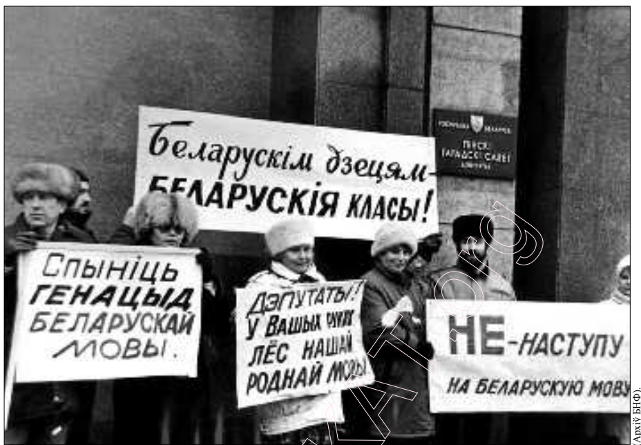
Прадэст супраць „новага парадку” Лукашэнка і КС. Снежань 1994 г.

папярэджалі, што Дамова (праект распрацоўваўся ў Маскве) складзеная „з мэтай забяспечыць на міждзяржаўным узроўні палітычныя, прававыя і эканамічныя ўмовы для інкарпарацыі Беларусі ў Расейскую Фэдэрацыю, падрыву нашай дзяржаўнай самастойнасці, падпарадкавання нашай эканомікі Расеі, захопу нацыянальнай уласнасці і маёмасці расейскімі суб’ектамі гаспадарання, юрыдычнымі і фізычнымі асобамі”.