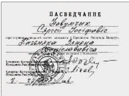
Пасьведчаньне С. Навумчыка аб даверанай асобе кандыдата ў Прэзыдэнты Рэспублікі Беларусь З. Пазыняка. 7.06.1994 г.

Паводзіны беларусафабаў зразумелыя: у справе дзяржаўнай незалежнасьці і існаваньня Беларускай нацыі беларуская мова ёсьць галоўным чыннікам і яны (у адрозьненне ад некаторых беларусаў) ўсьведамляюць гэта.