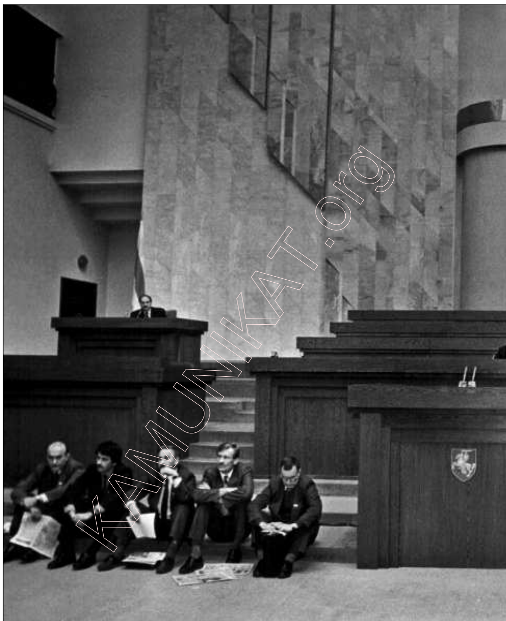
Галадоўка дэпутатаў Апазыцыі БНФ у Вярхоўным Савеце.