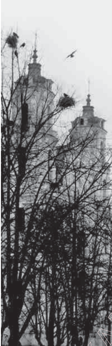
62. Віленскія вежы. 2002 г.