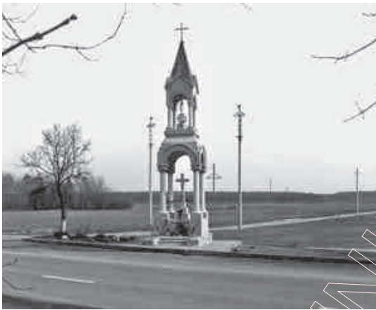
63. Капліца ля Салечнікаў. 2003 г.