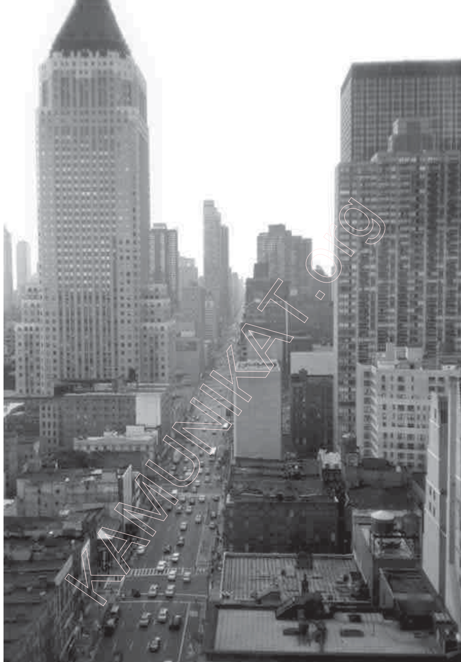
68. Манхэттан з вакна хмарачосу, 1999 г.