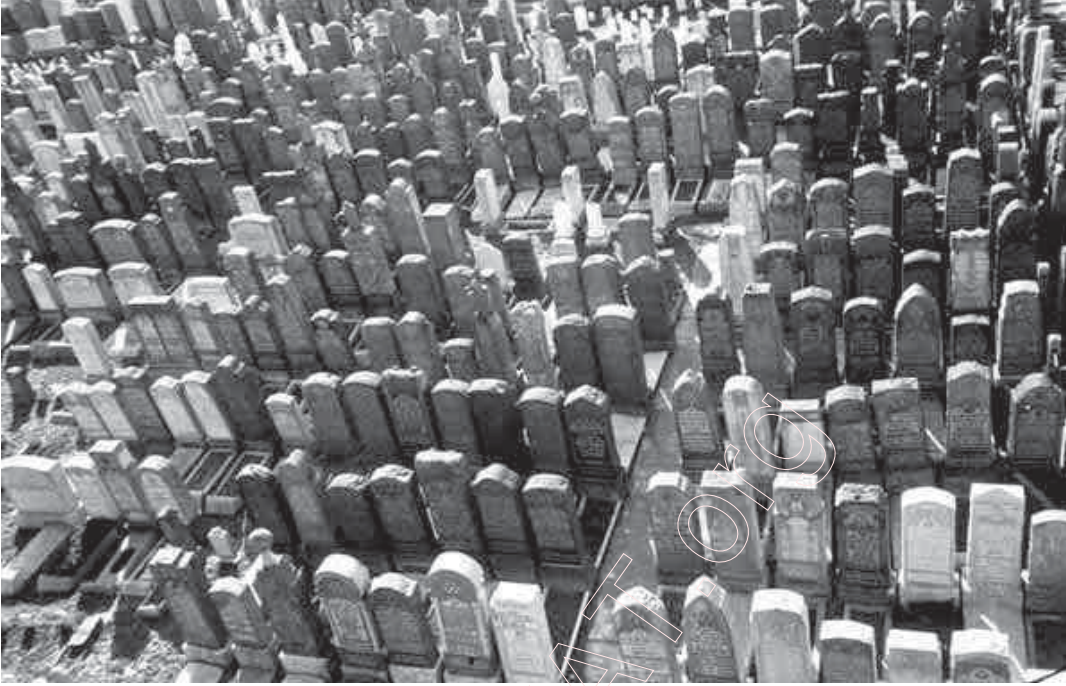
70. Габрэйскія могілкі на „Бэй Паркўэй”. Бруклін. 2001 г.