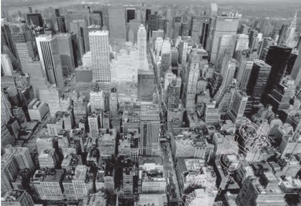
71. Манхэттан з вышыні. 1998 г.