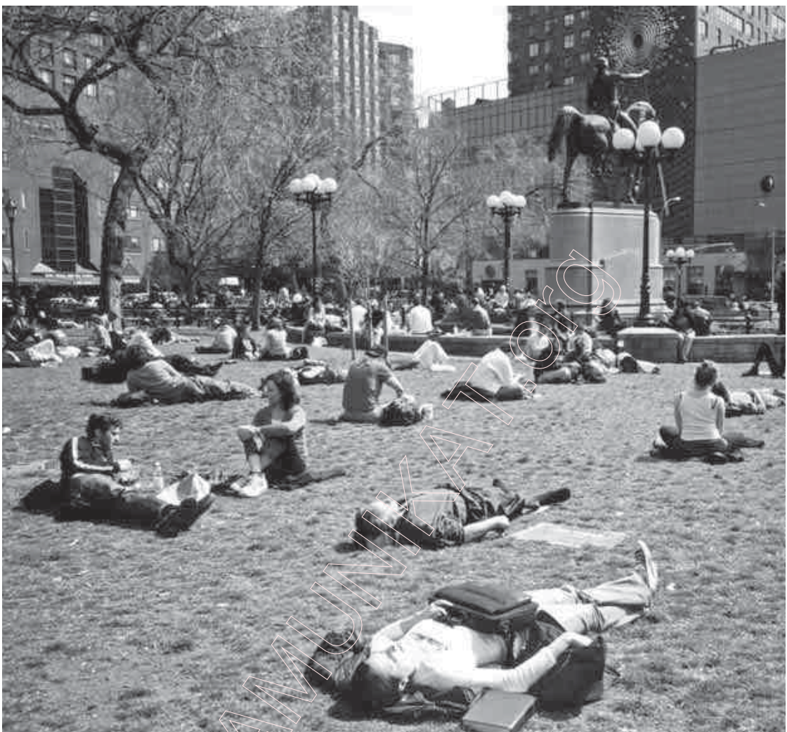
73. Манхэттан. Вясновы дзень. 2004 г.