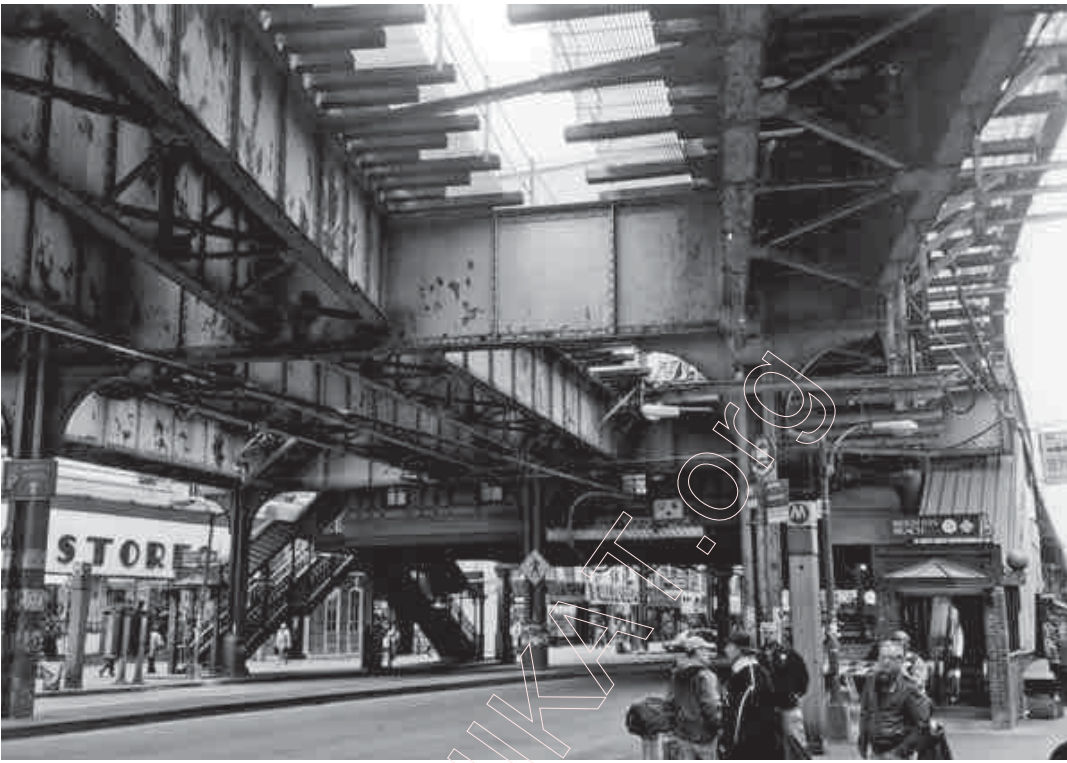
120. „Брайтан-біч эвэню” (1).