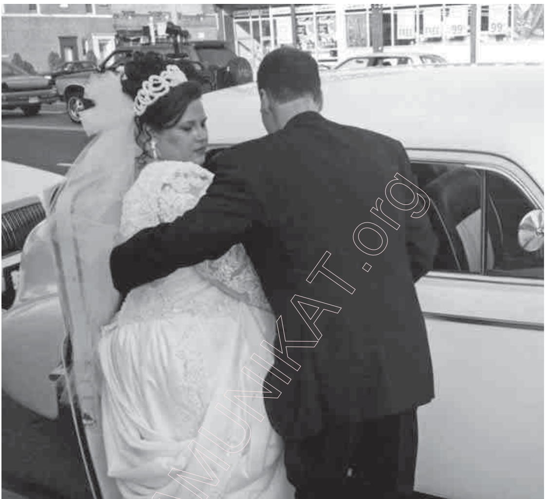
123. Лацінські квартали. Жаніх пасья ўзяўця шлюбу ў касьцёле садзіць маладоў у машыну. 1997 г.