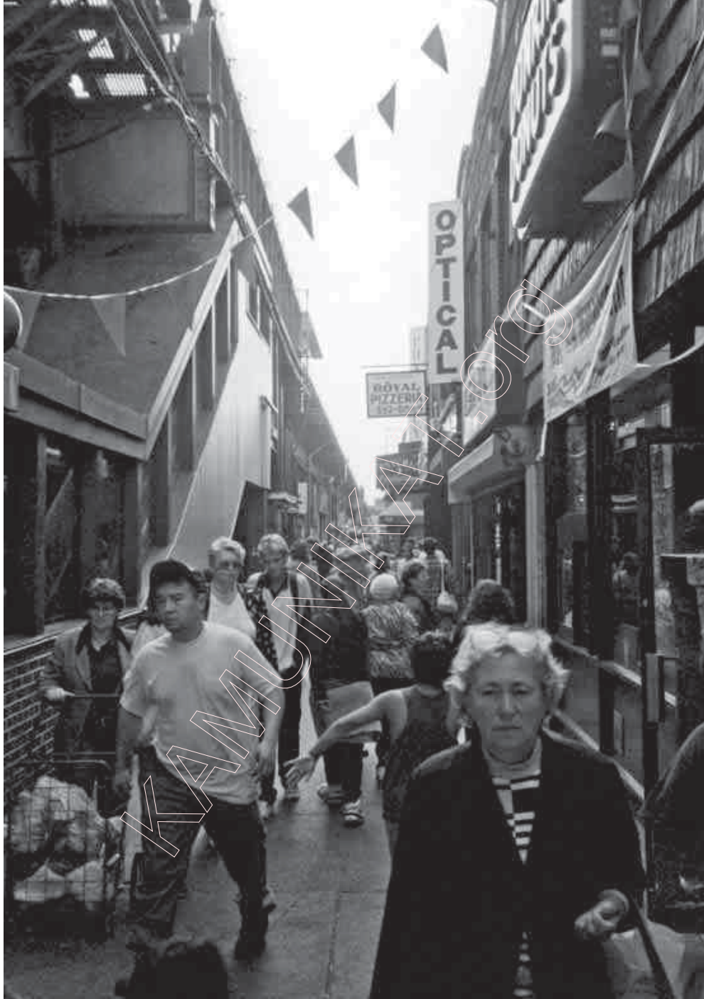
121. „Брайтан-бич эвэню” (2). Фота 1996 г.