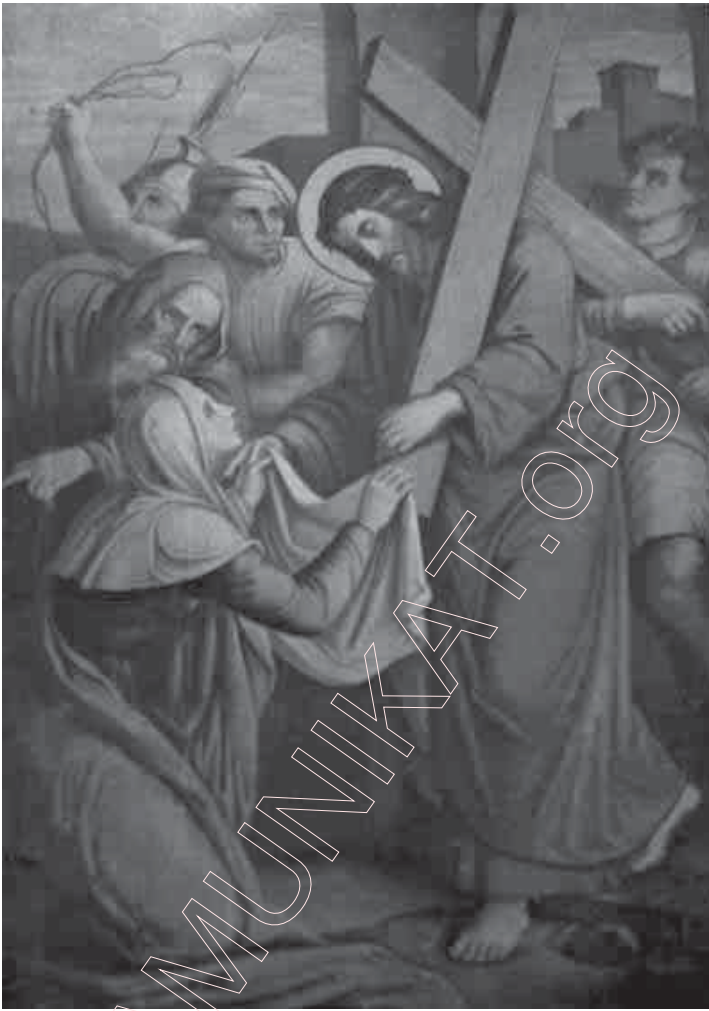
135. Нясьвіж. Абраз з галоўнага алтара ў фарным касцёле. Фота 1964 г.