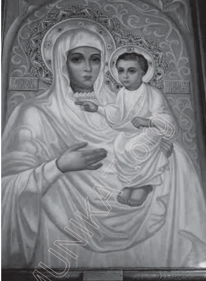
134. „Маці Божая Беларуская” (Аматарская копія. Праваслаўны сабор у Беларастоку). 2000 г.