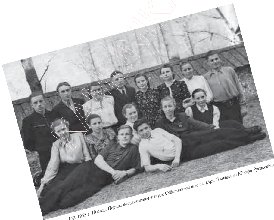
142. 1955 г. 10 клас. Першы пасляваенны выпуск Суботніцкай школы.