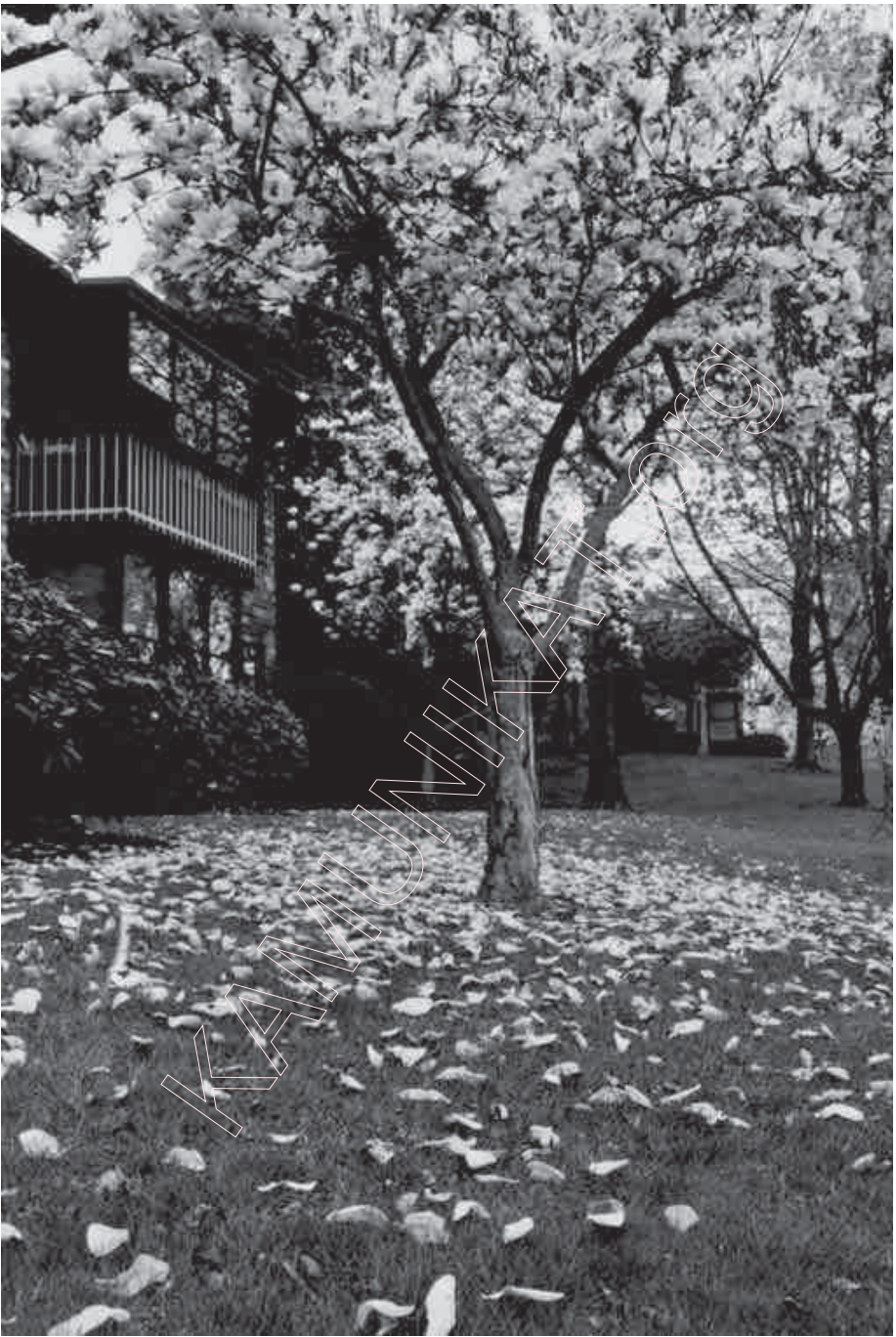
146. Ападае магнолія. 2003 г.