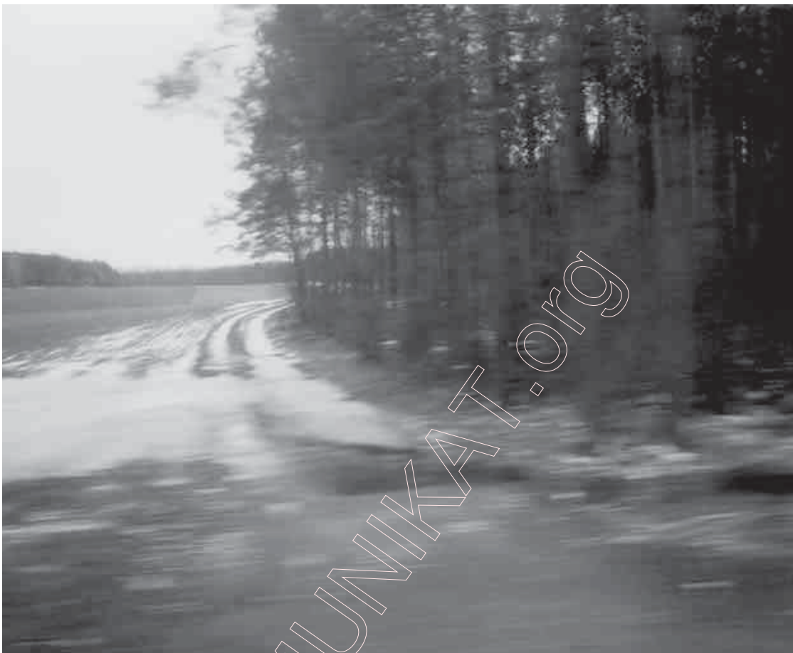
148. Родная карціна. 2000 г.