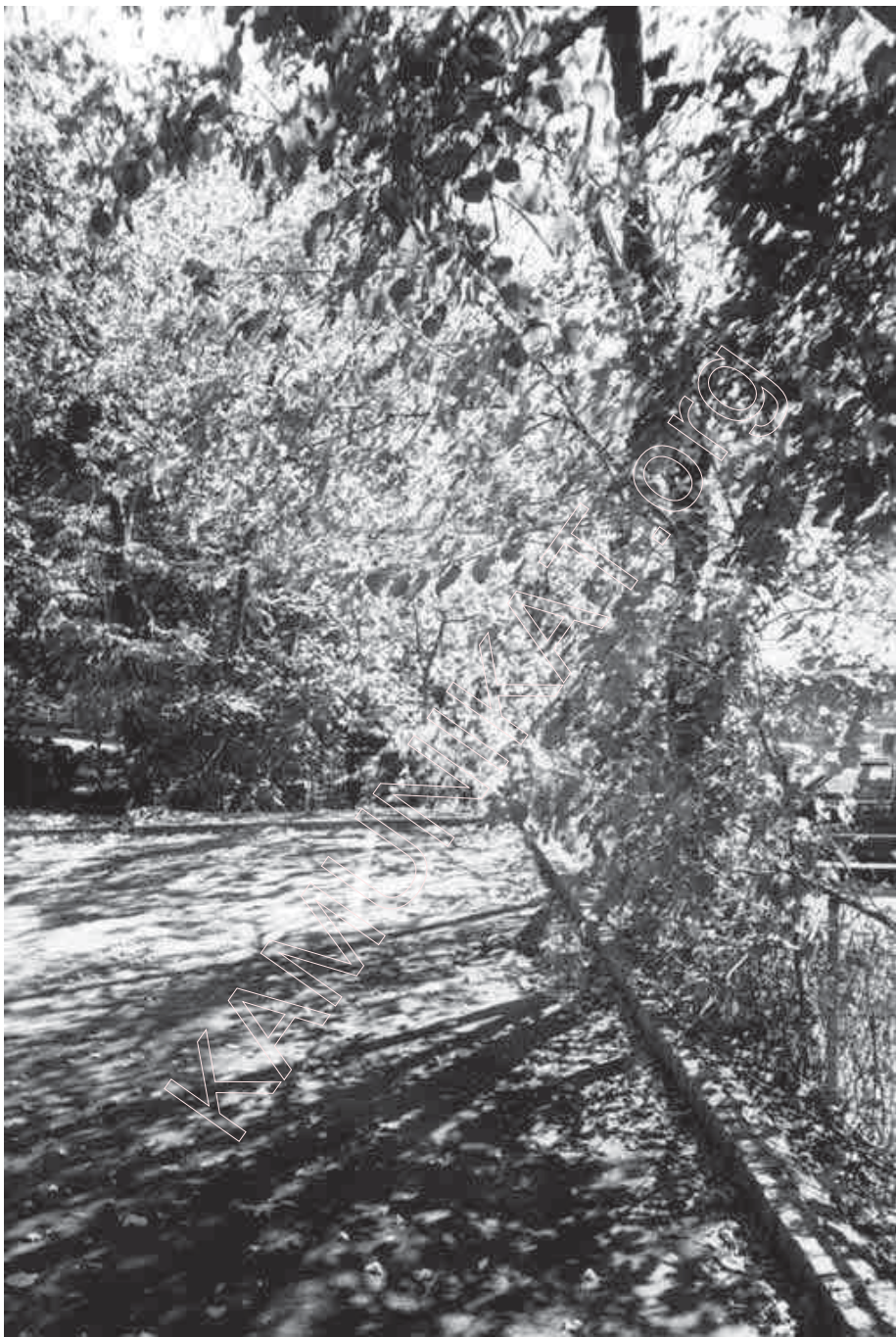
145. Асеньня прамні. 1997 г.