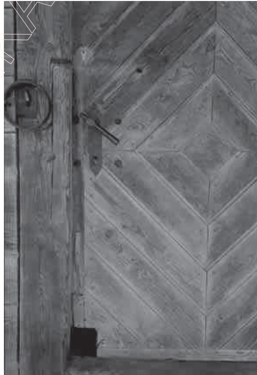
160. „Беларускія дзверы”. Сьвіран у Майшаголе. 2006 г.