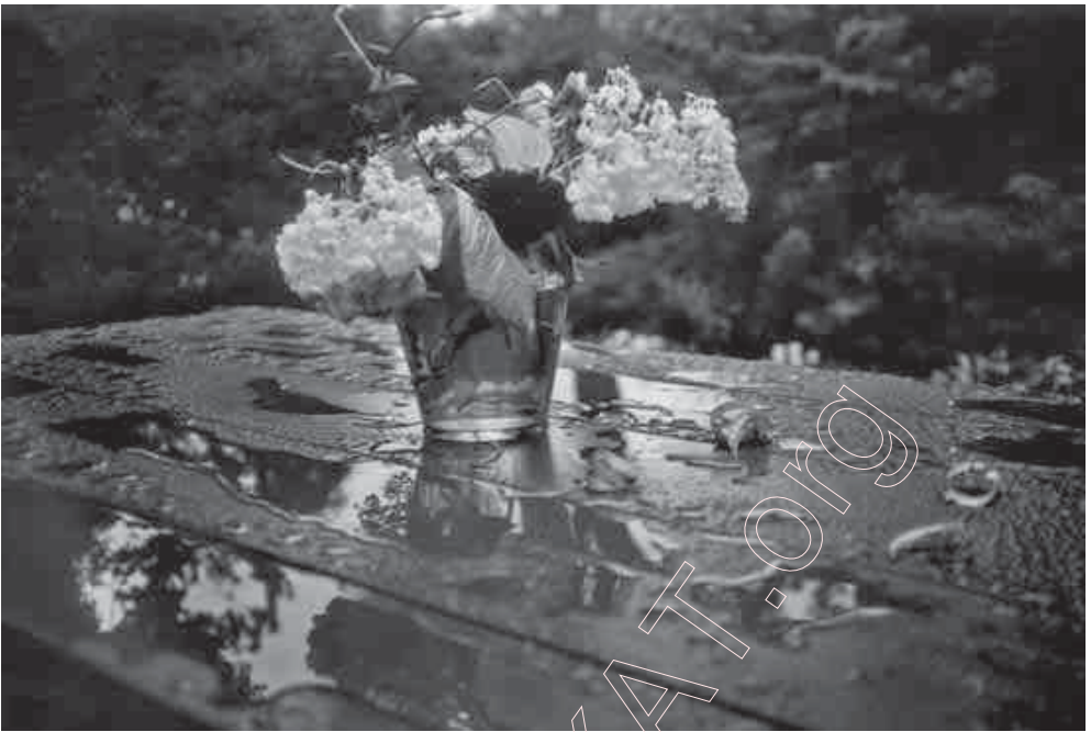
159. На верандзе пасля дажджу. 1999 г.