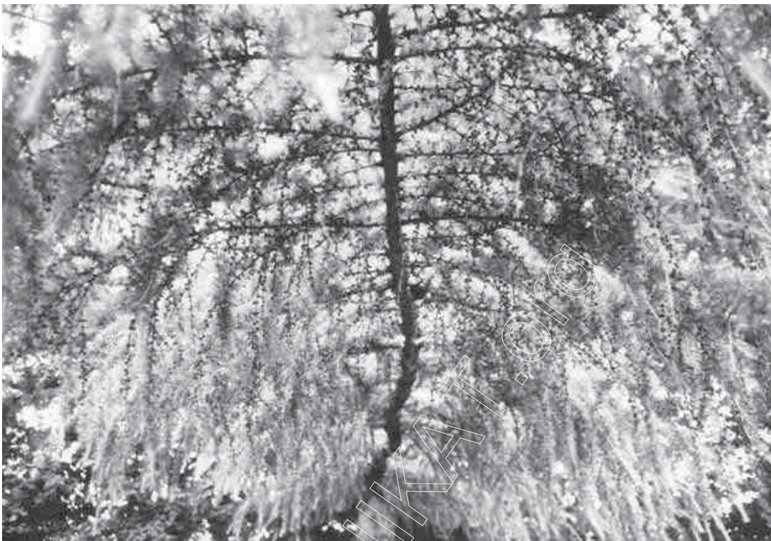
162. Листоўніца ў праменьях сонца. 1998 г.