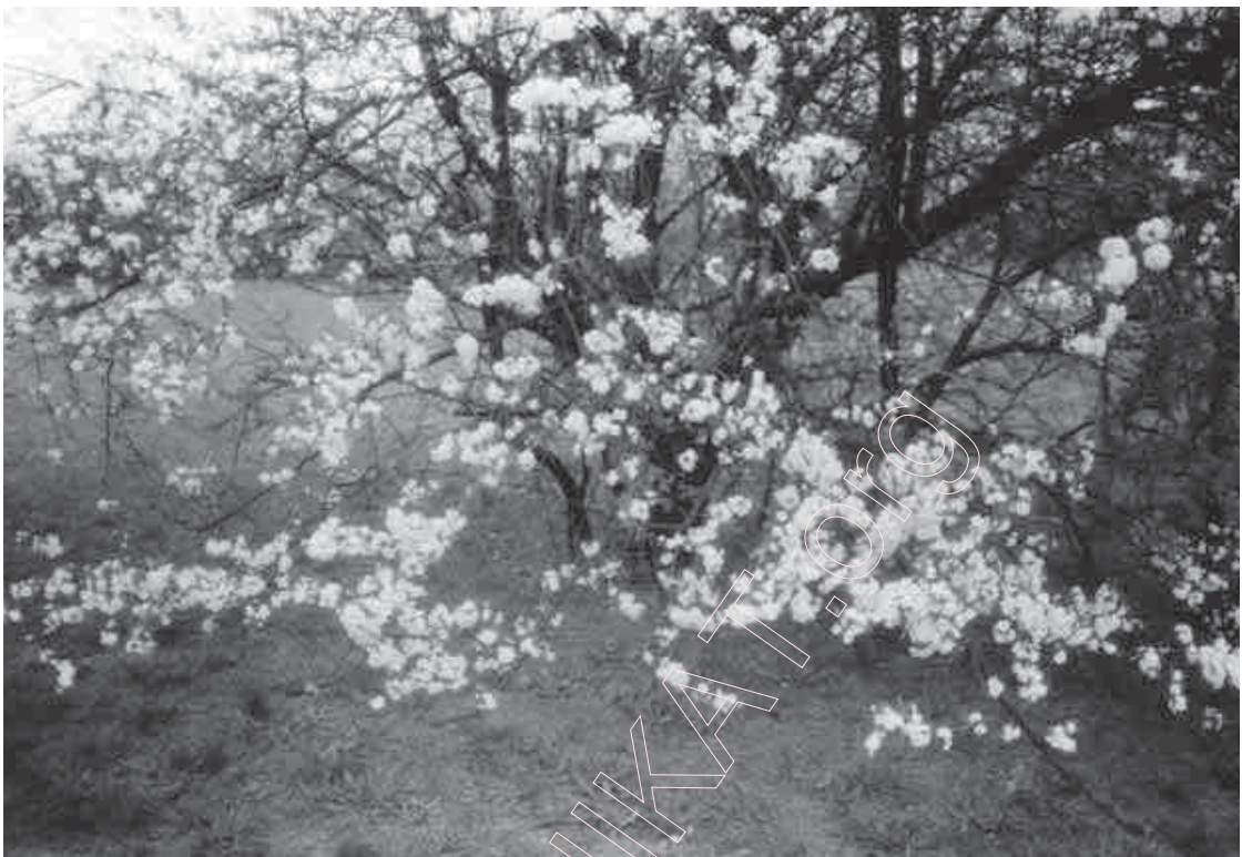
151. Цвітуць мірабэльні. 1997 г.