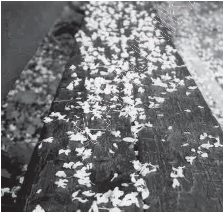
157. Апалы цьвет. 2004 г.