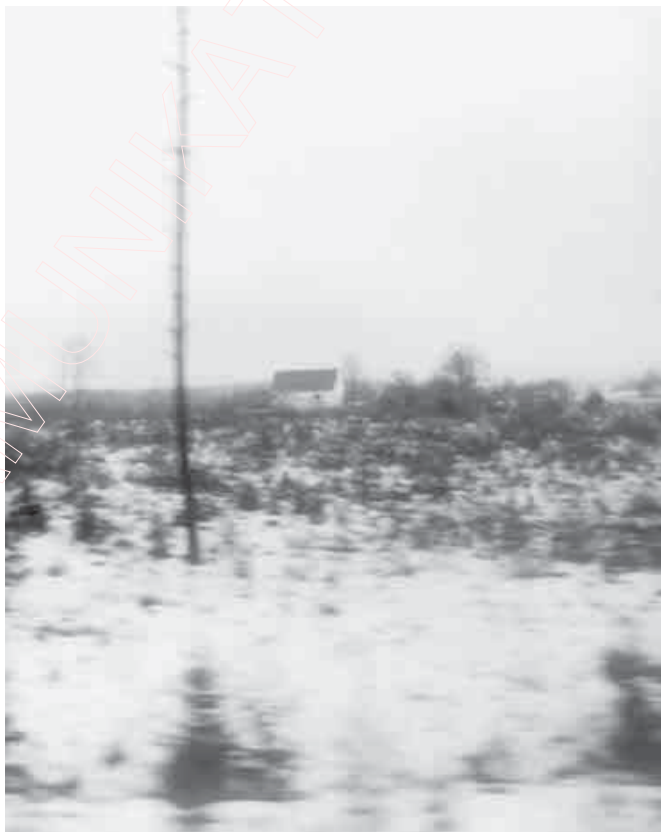
164а. Краявід з зімавага сну. 1997 г.