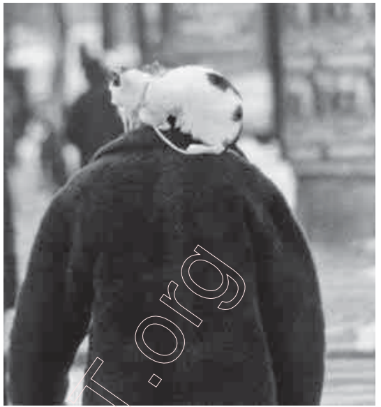
154. Чоловік з котом. Вільня 2000 г.