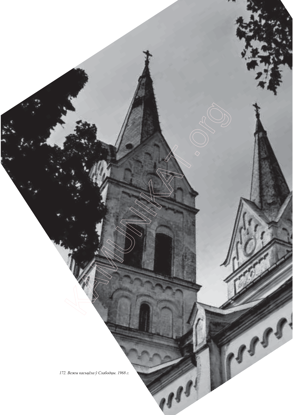
172. Велы касьцёл ў Слабодцы. 1968 г.