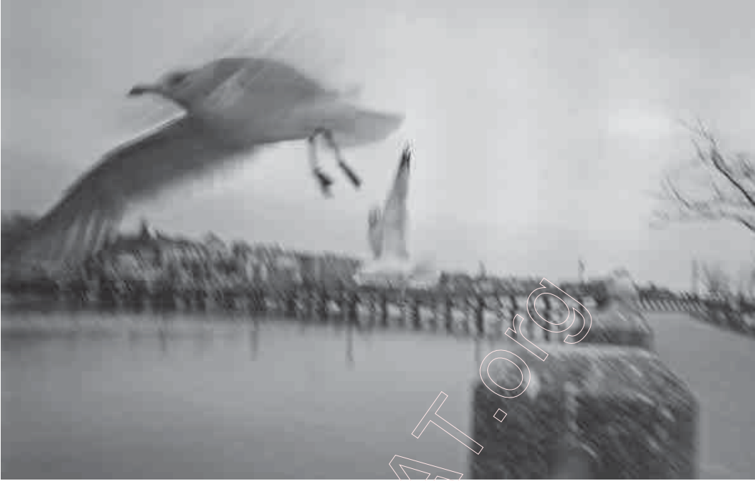
169. Перапужская чайка. 2002 г.