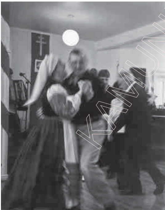
170а. Беларуская полька. 2003 г.