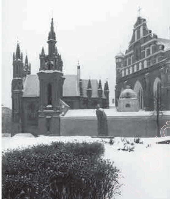
177. Зімовая „Ганна“ і „Бернардынец“. Вільня. 2000 г.