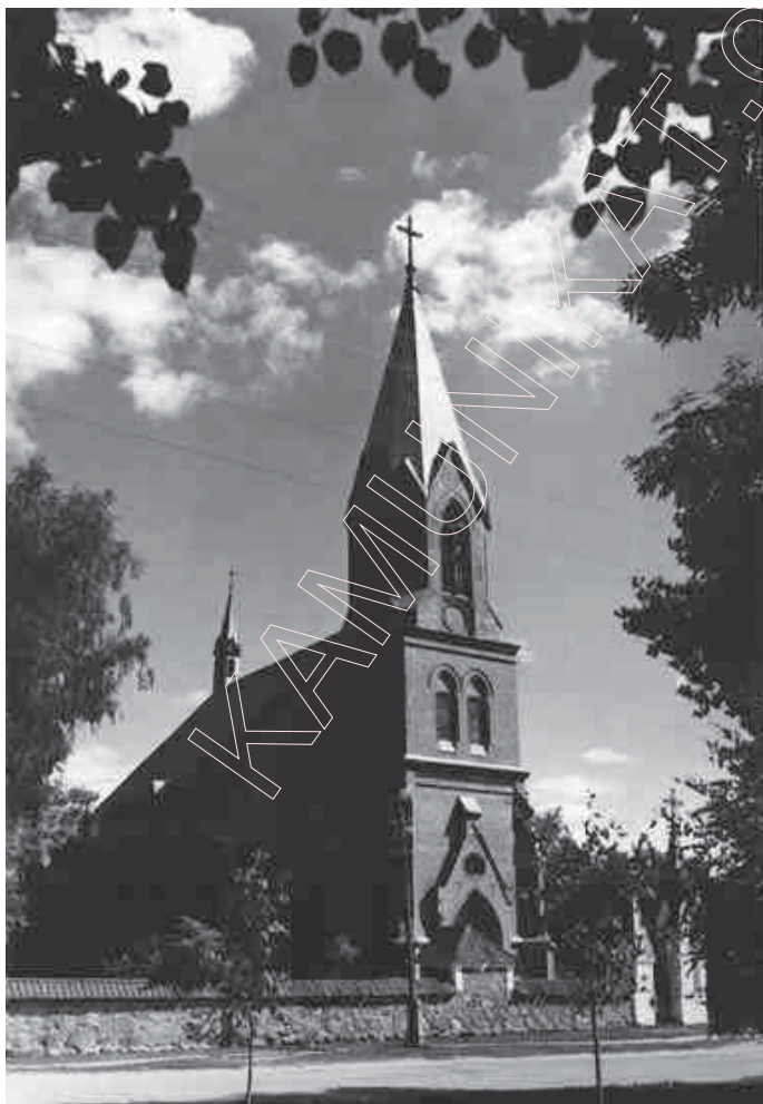
178. Суботніцкі касцёл. 1965 г.