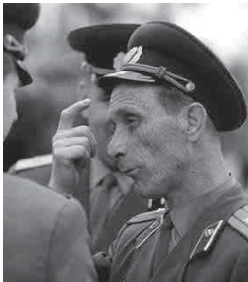
188. Расейцы. З цыклу „Акупацыя”. 1964 г.