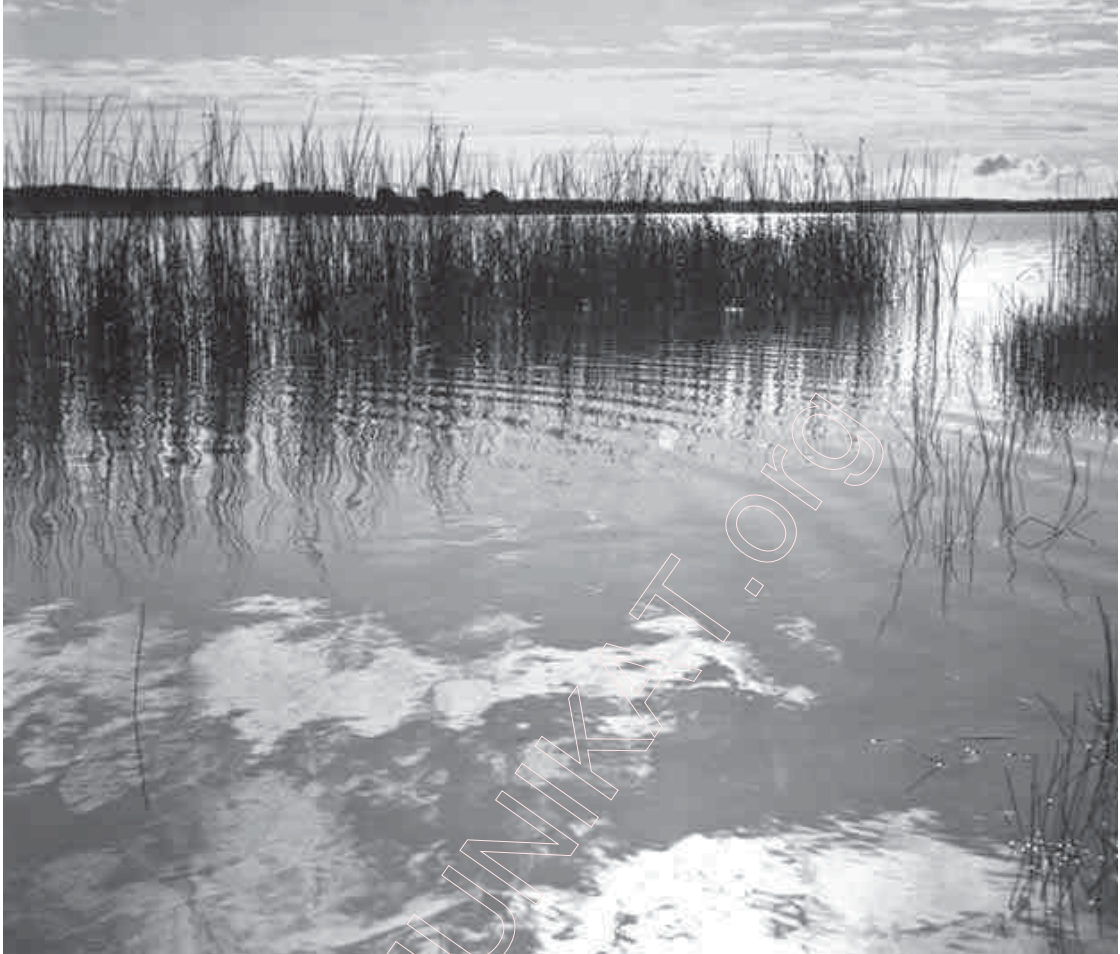
8. На Браслаўшчыне. 1968 г.