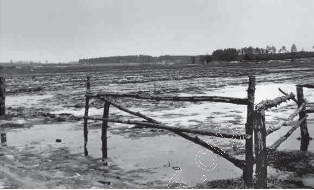
5. Сакавік у Суботіках. 1959 г.