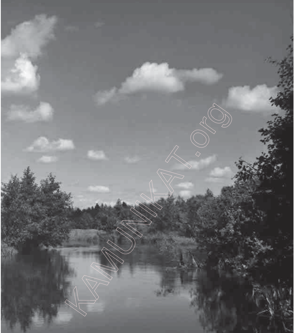
17. Гаўя каля Рыбакоў. 1964 г.