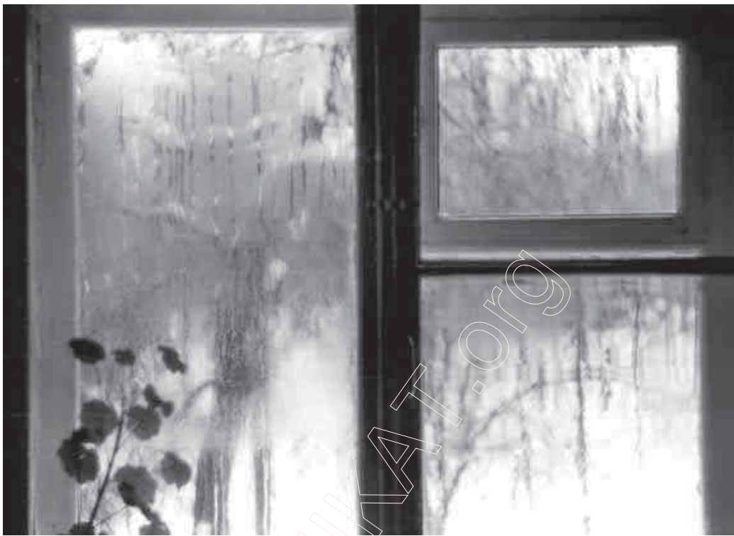
21. Менскае вакно. 1995 г.