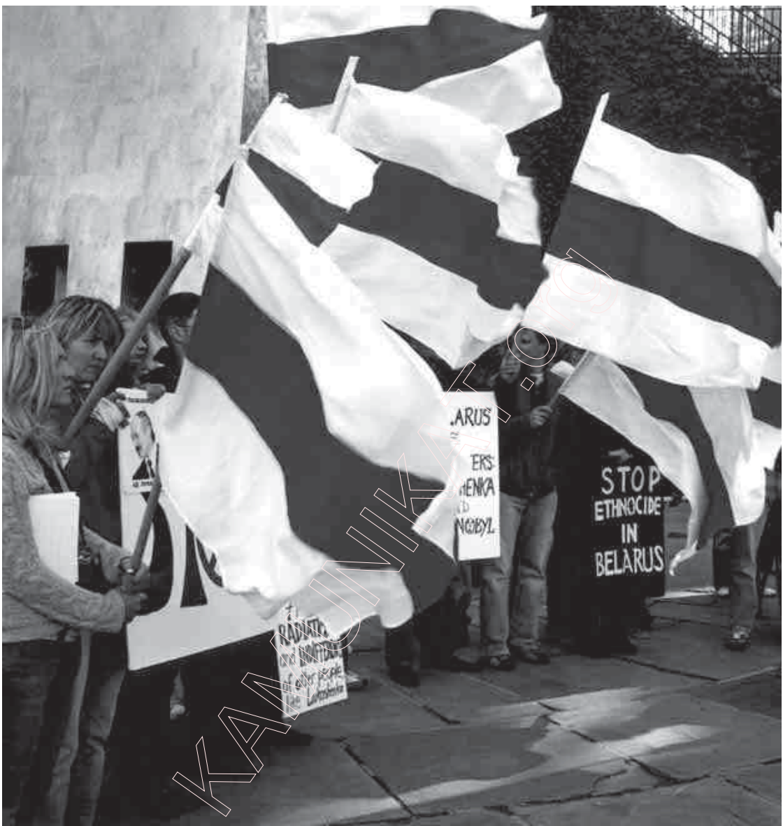
23. Беларускія сьцягі ў Нью-Ёрку. 2005 г.