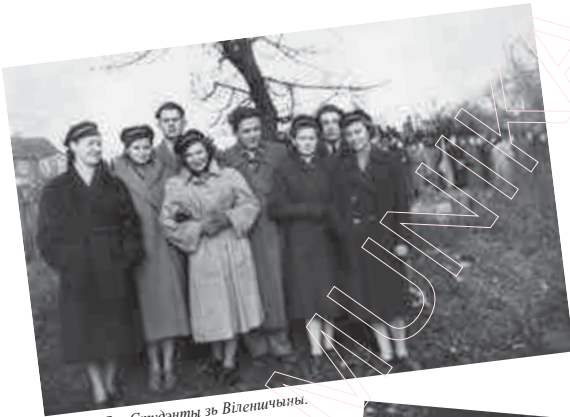
224. 1957 г. Студэнты зь Віленічыны.