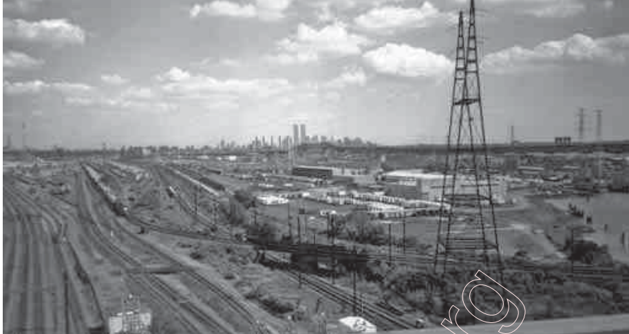
229. Тэхнагенны краявід перад Нью-Ёркам. 1996 г.