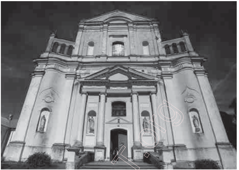
226. Галоўны фасад касцёла ў мястэчку Шумск (Віленчына), 2006 г.