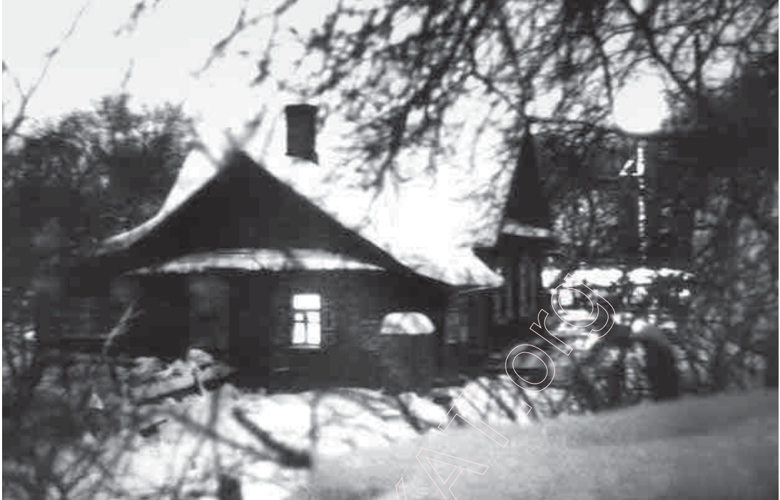
26. Менск. Вячэрняя Грушаўка. 1995 г.