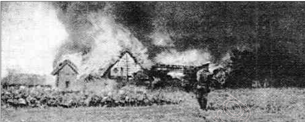
Першая Сусветная вайна. Расейцы, адступаючы, паліць беларускую вёску.

За 70 гадоў знаходжання ў складзе савецкай Расеі Смаленскі край быў вынішчаны дазвання і стаў падобным на астатнюю Расею. Вобласць абзялюдзела. Насельніцтва ў некаторых раёнах Смаленшчыны зменшылася ў 10 разоў, урадлівая землі пазарасталі хмызьняком і мохам.