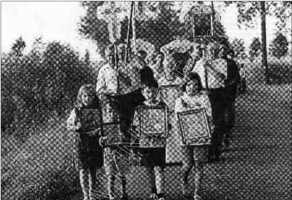
(font „Нас“) AMUNSHAT.ORG

Але беларусы бачылі, што такое маскоўская царква. Як і ў ранейшыя часы, адбываўся адплыў да пратэстантызму, хоць пратэстанцкія абшчыны за саветамі надзвычай жорстка пераследвалі. (Вернікаў не ўладкоўвалі на працу, выдумвалі штучныя абвінавачванні, судзілі ды ссылалі, здэкавалі над дзецьмі, вялі шалёную прапаганду, прыдумвалі дзікія небывілы, распальвалі нянавісьць да пратэстантаў і г.д.)