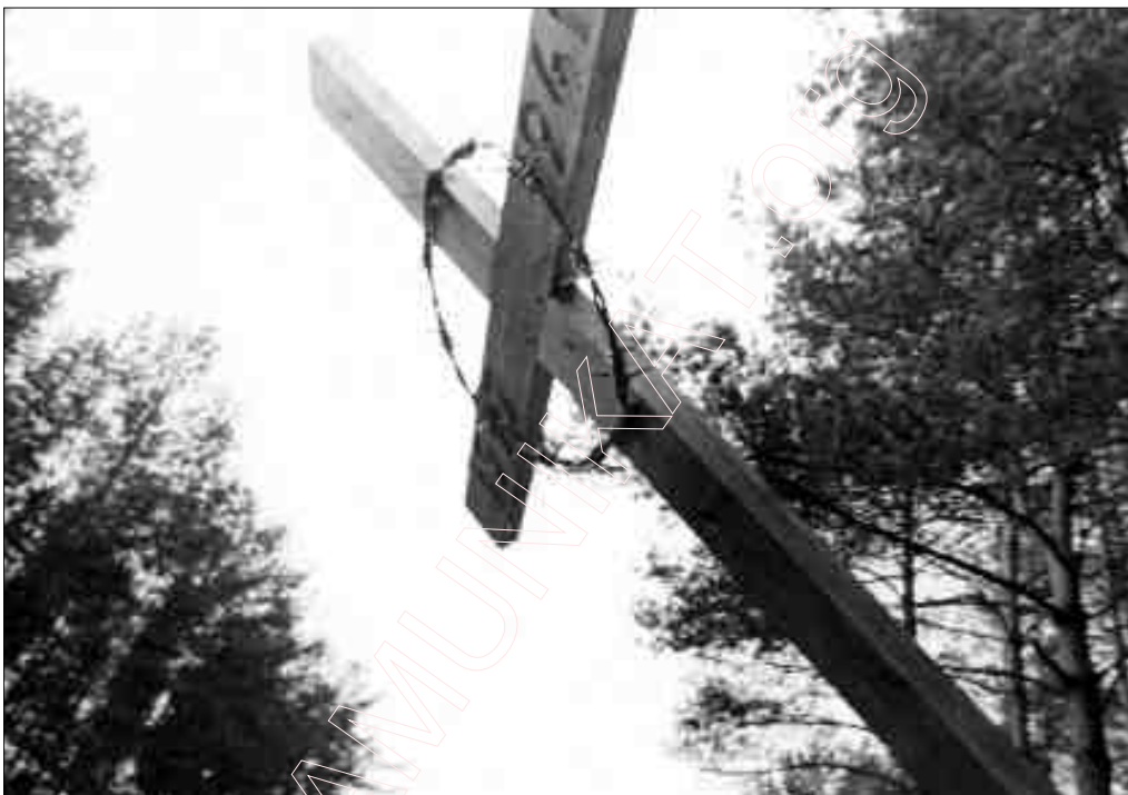
Курпацкі крыж. Беларускі помнік XX-га стагоддзя.

Для нас, беларусаў, гэтыя сто гадоў былі драматычным выпрабаваннем, поўным сьмерцю і пакутаў. Тым ня менш, мінулае стагоддзе стала для нас больш выніковым, чым XIX-е, калі ўсе нашае паўстанні і войны з Расеяй не далі выніку.