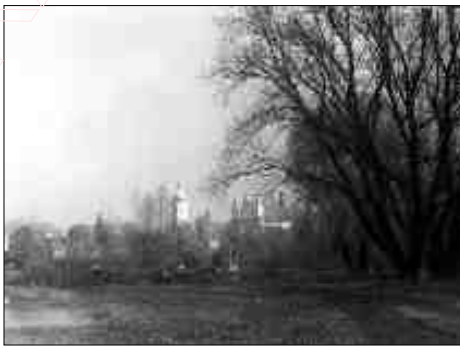
Вакаліца над Пінскам.

Паміж мястэчкам і горадам існавала рэгулярная чаўночная міграцыя і сувязь (гандлёвага, адміністрацыйнага, канфэсійнага і іншага парадку). У мястэчку і ў горадзе быў у прынцыпе аднолькавы характар культуры, толькі ў мястэчку ў меншым маштабе. (Дарэчы, і архіўныя, і архэалагічныя матэрыялы добра гэта пацвярджаюць.)