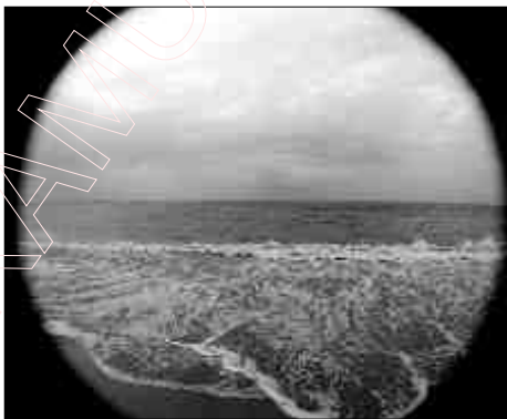
(Фота 3. Павялоў)

Грамадства валодае сістэмай абмежавальных мэханізмаў, каб свабода не ператварылася ў несвабоду, але яно не заўсёды здольнае іх ужываць, бо стрымліваньне зла залежыць ад