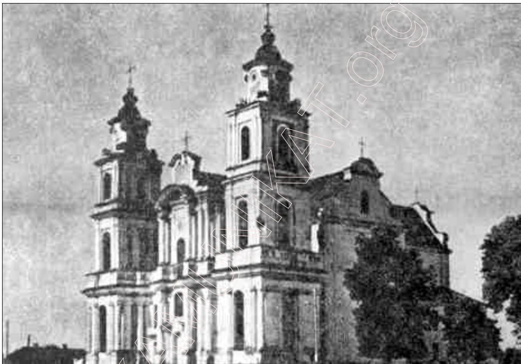
Касцёл у Будаве. Здымак 1930-х гг.

Дынамічным чыньнікам, маторам эўрапейскай культуры былі