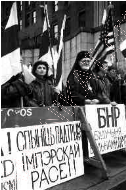
Беларусы на дэманстрацыі ў Нью-Ёрку.

21 траўня 2001 г. („Беларускія Ведамасьці”, — 2001, №8(38).