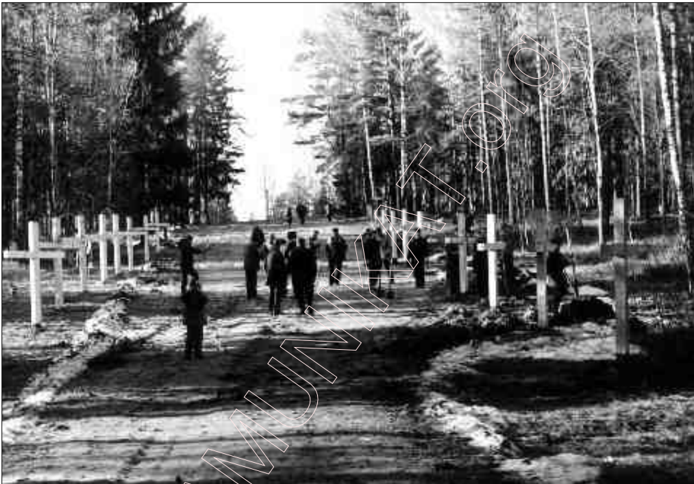
Курапаты. XXI-е стагодзьдзе. Сакавік.

Праз чатыры гады КГБ поўнасьцю захапіў уладу ў Расеі. Там цяпер няма камунізму, але ёсьць канцэнтрацыйныя (фільтрацыйныя) лягеры, праводзіцца генацыд і зьнішчэньне Чачэніі з ужываньнем войска і сучаснай разбуральнай зброі, душыцца друк і ўведзена вайсковая цэнзура. Вусная інструкцыя для рускіх вайскоўцаў абавязвае забіць усіх чачэнаў ад 10 да 60-ці гадоў. Людзей замыкаюць у фільтрацыйныя лягеры, дзе іх катуюць, прыніжаюць і мядруюць. Пляны расейскага камандваньня заключаюцца ў тым, каб забіць дзьве траціны чачэнскай нацыі, разбурыць і абязлюдзіць горную частку краіны.