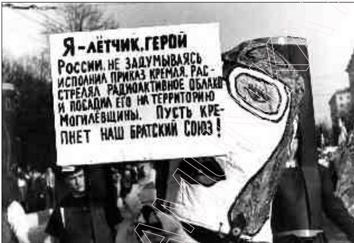
Чарнобыльскі шлях у Менску.

Вернемся ў 30-я гады. Я ўжо не аднойчы пісаў раней, што сталінскі генацыд на Беларусі меў асаблівы характар. Беларускае насельніцтва вынішчалі плянава. Усім савецкім адміністрацыйным і партыйным кіраўнікам спускалі разнарадку на квартал выявіць адпаведную колькасць „ворагаў народу”. Разнарадка спускалася на кожную беларускую вёску і на кожнае прадпрыемства. Кожнае міністэрства мела свой адзел па ГУЛАГу.