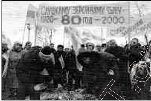
Ушанаваньне памяці Слуцкіх герояў.

Памятайма: беларус беларуса падтрымліваец . Мы мусім абараняць свой свайго, беларус беларуса перад чужакамі , незалежна ад таго, бедны беларус, ці багаты, разумны, ці неразумны, добры, ці дрэнны. Нельга, каб беларус прадаваў беларуса . Нельга дапускацца, каб нас судзілі акупанты. Мы самы сабе судзім.