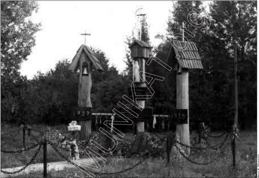
Помнік вясцоўцам — ахвярам бальшавізму ў вёсцы Чарназубава (Копыльскі раён).

Ужо ў 1943-м годзе ў беларускіх лясах дзейнічала агулам ад трохсот да чатырхсот тысячаў партызанаў. Масква не давярала беларусам. Таму пад канец вайны, ў выніку спецыяльнай апэрацыі НКВД, многія беларускія камандзіры былі пасланыя на сьмерць,