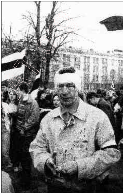
Менск, 1997. Змагар за Беларусь.

Таму беларускі напрамак быў аб'яўлены кірункам нумар 1 па важнасці ў расейскай знешняй палітыцы, і ўся магутнасць яе спецслужбаў, дыпламатыі, хітрасьць розумаў „гайдароў” і так званых „расейскіх дэмакратаў” запрацавалі ў зададзеным рэжыме.