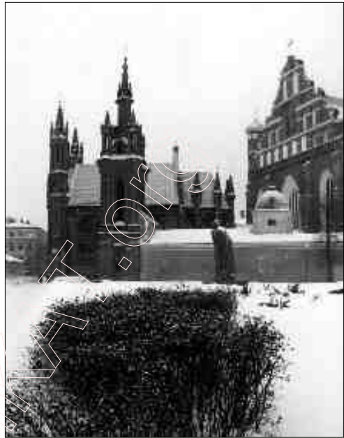
„Сьвятая Ганна“ і „Бернардынец“. Вільня, 2001 г.

рабочыя месцы, заробкі. І савецкі „пралетар“, даведзены да галечы гэтымі калябарантамі ды чужынкамі, павінен (па задуме) узрадавацца, што ўзамен за ягоную нацыянальную ўласнасьць дадуць яму пустыя гарантыі працы на прыбытак рабаўніку. (Як быццам нешта значаць гарантыі беднаму ды слабому.)