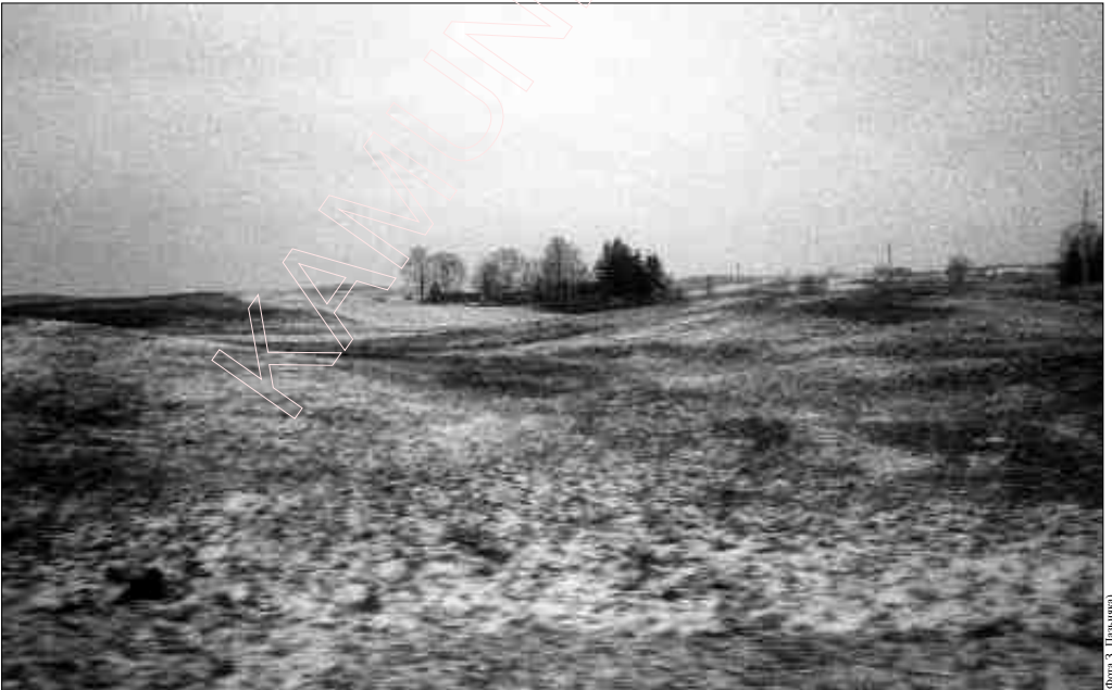
(Фота 3. Пазьмина)