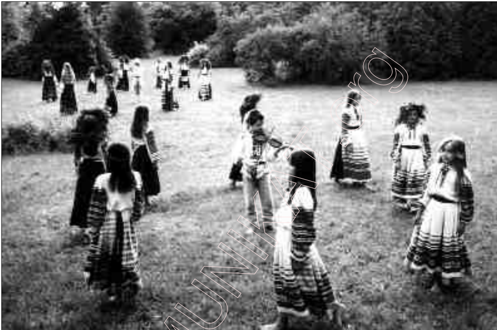
Дзіцячы фальклёрны тэатр „Госыціца”. Менск.

Мова, якая ў сваёй фэнаманальнай сутнасьці зьяўляецца наймагутнейшым сродкам культуры (бо фармалізавала і сфармавала чалавечае думаньне), у пэрыяд стварэньня нацыяў асаісоўваецца якраз у гэтым культуралігічным значэньні як галоўны, зьяўляючы і культурны чыньнік нацыі.