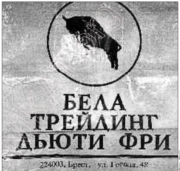
Чарговы „обіччэчлавецкі“? Дую свік Беларэйшан?

Трынаццаць гадоў таму мне ўжо приходзілася пісаць пра