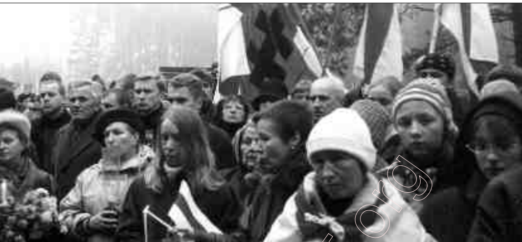
(Фота Ул. Керпініна)