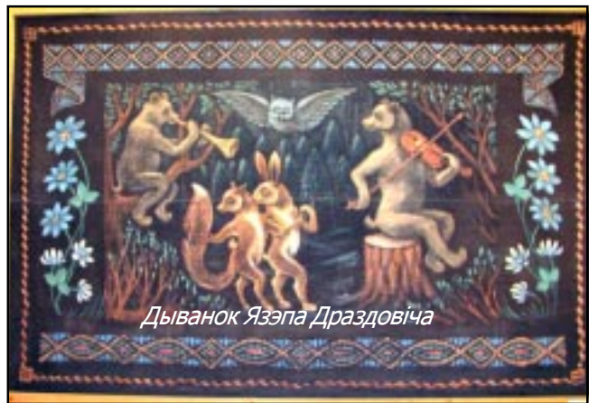
Дыванок Язэпа Драздовіча

Перад удзельнікамі імпрэзы выступілі барды Таццяна Беланогая і Зміцер Бартосік,