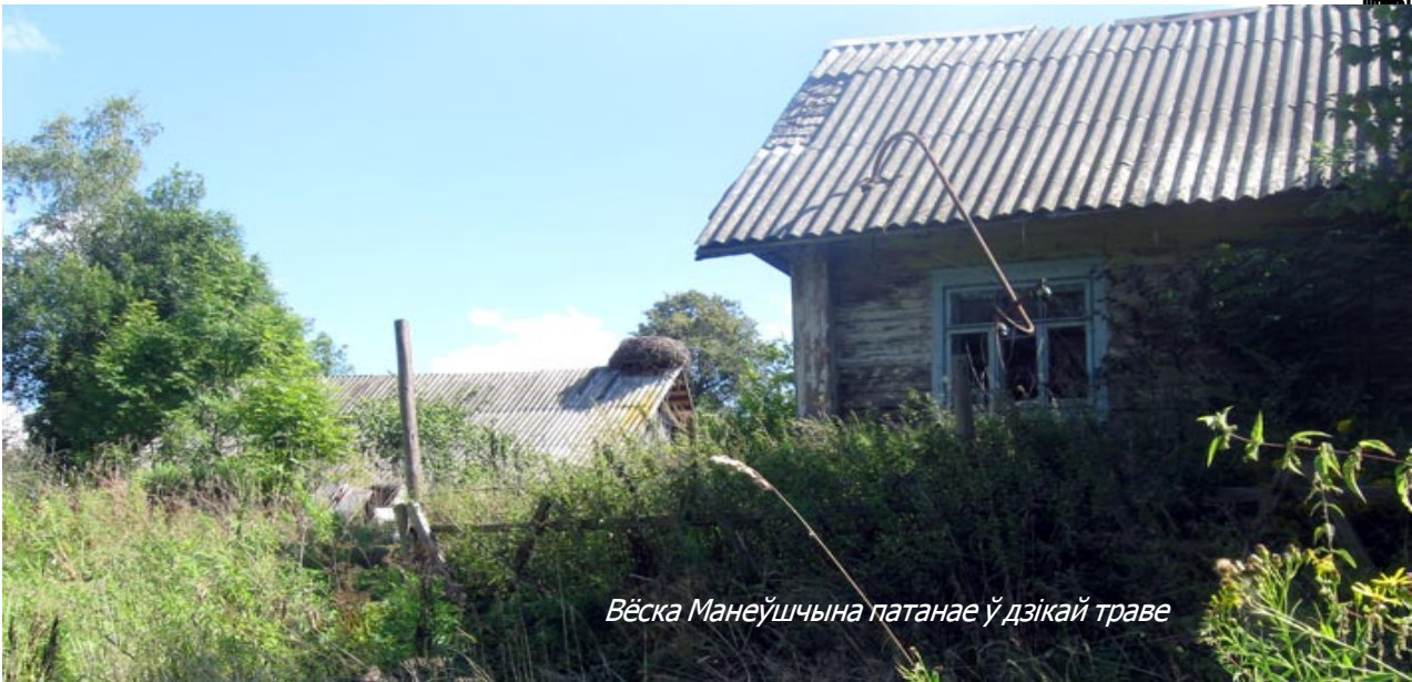
Вёска Манеўшчына патане ў дзікай траве

старэйшых), хто ў іншыя месцы. Сям'я Марыі праз тыдзень вярнулася назад у Манеўшчыну, а бацька крыху раней. У 1944 годзе, пасля вызвалення, на фронт з вёскі трапіла 6 чалавек і яшчэ адзін быў