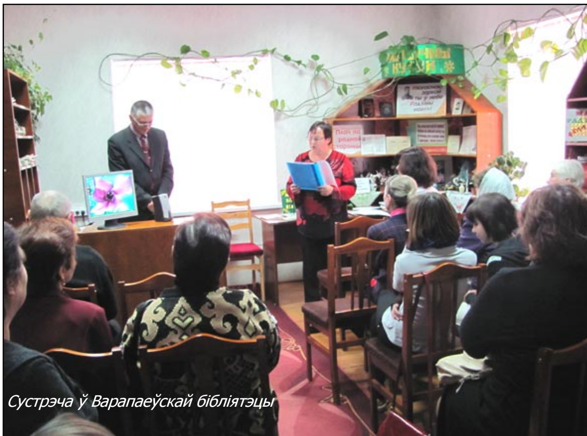
Сустрэча ў Варапаеўскай бібліятэцы