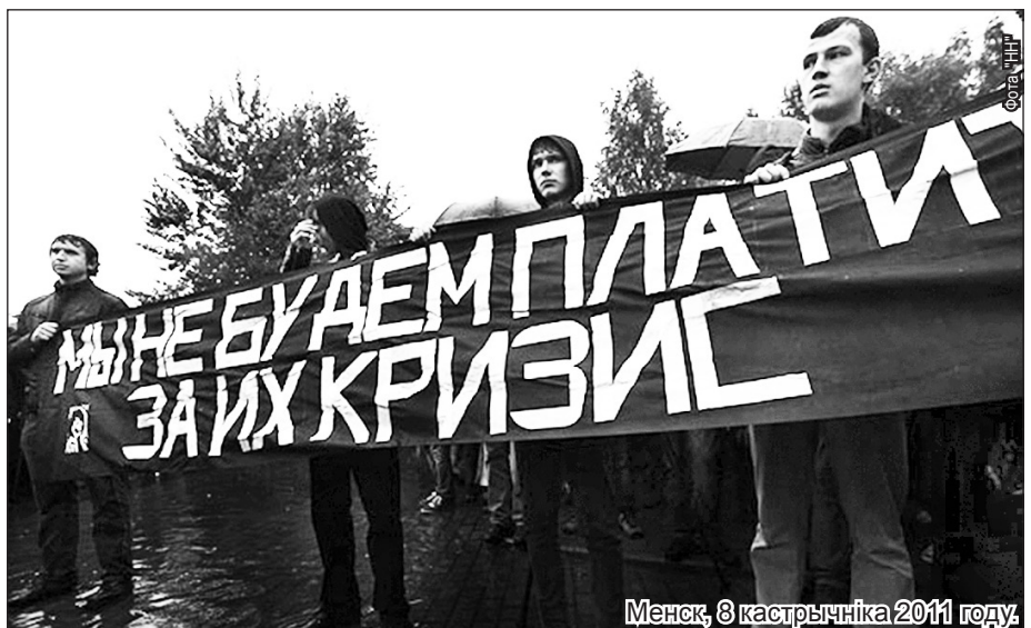
Менск, 8 кастрычніка 2011 году.