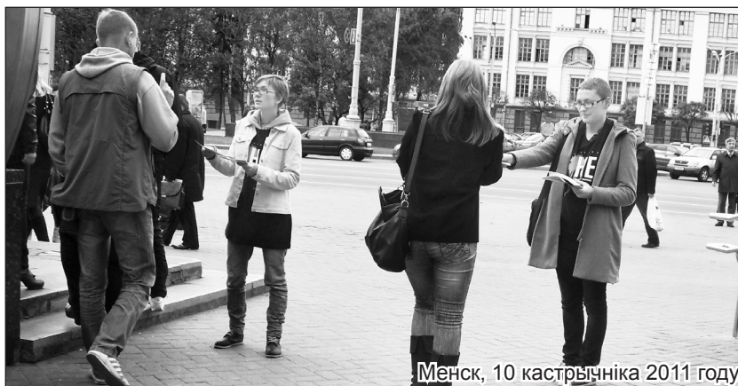
Менск, 10 кастрычніка 2011 году.

У Менску актывісты кампаніі "Праваабаронцы супраць сьмяротнага пакараньня" выйшлі на праспект Незалежнасьці, каб нагадаць мінакам, што ў Беларусі дагэтуль дзяржава забівае людзей. Інфармацыйныя буклеты, паводле сло-