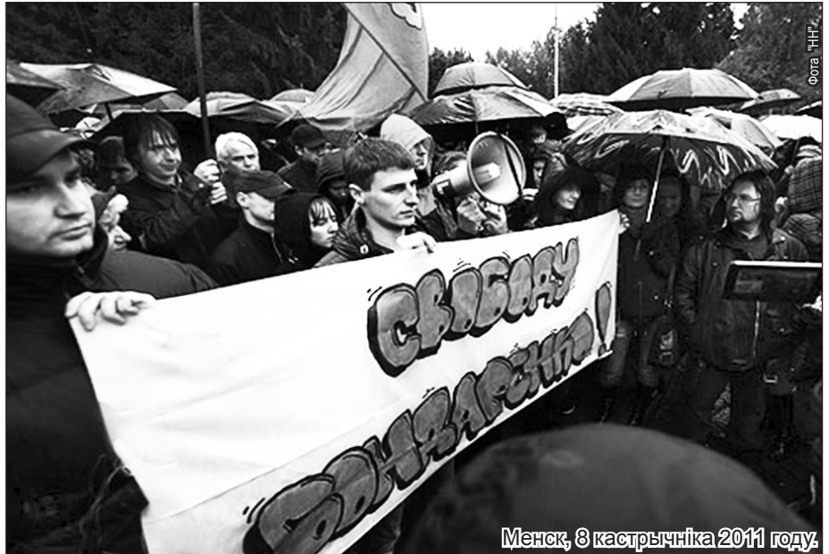
Менск, 8 кастрычніка 2011 году.

Праваабарончыя матэрыялы можна таксама прачытаць на сайтах: www.spring96.org ; www.charter97.org ; www.baj.by