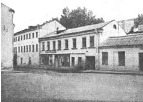
Вуліца Камсамольская (былая Феліцыянская). Фота 1983 г.

Рэвалюцыйная) перасякала выгінастая, са складанай канфігурацыяй трасы, вуліца Феліцыянская, якая выходзіла на Нямігу. У пачатку XIX ст.