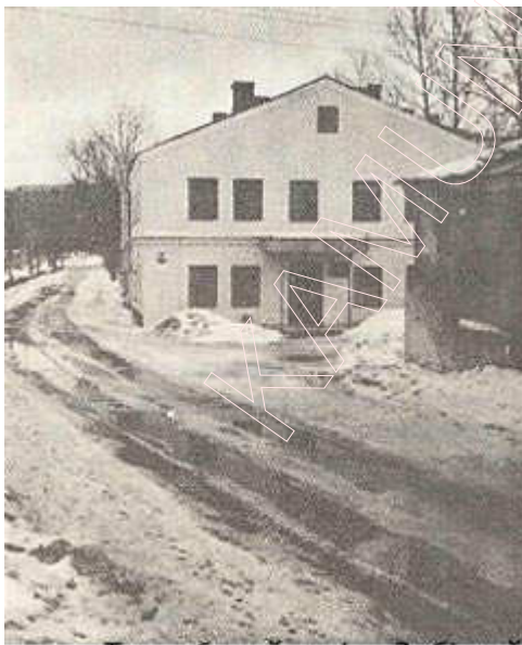
Траса былой вуліцы Зыбіцкай (цяпер Гандлёвая).

Але «збудаваць» можна і мураваную пабудову. Апошнія слова ўжываецца ў шырокім сэнсе, калі гаворыцца пра ўсялякае будаўніцтва. Што датычыць Гваньіні, то ён апісвае перш за ўсё агульны характар горада і замка, не ўдаючыся ў дэталізацыю гарадской архітэктуры і асобных пабудов. «Мінск — вялізны драўляны горад,— пісаў А. Гваньіні,— замак яго зроблены з дубу, размяшчэнне яго і форма спрыяльныя для абароны; замак абкружаны глыбокім ровам і ракой, на якой ёсць некалькі грэбляў».