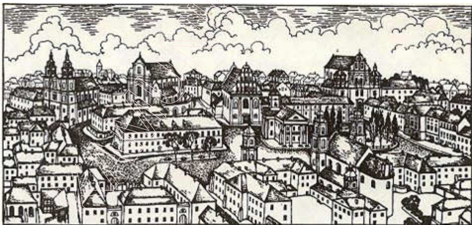
Высокі рынак у пачатку XIX ст. (малюнак і рэканструкцыя В. Сташчанюка)

На Высокім рынку ствараўся гарадскі комплекс са сваім вобразам і архітэктурным ансамблем, які прадугледжваў найперш рацыянальны горадабудаўнічы план.