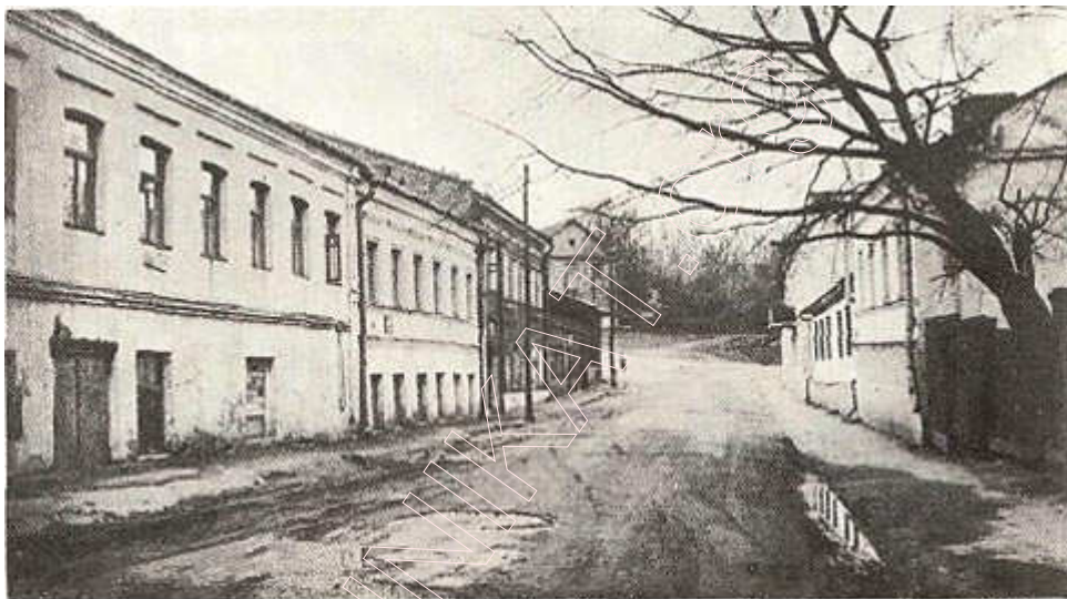
Самая старая вуліца ў Мінску – Замкавая. Фота 1983 г.

вуліца прадаўжалася і за валам аж да перасячэння з Вялікай татарскай. Зараз яшчэ захавалася частка завальнай яе трасы, што прымыкае да вуліцы Дзімітрава. Тут захаваліся і пабудовы XVIII — XIX стст. З паўднёвага захаду Замчышча агінала вуліца Завальная; з паўночнага захаду — Завальны завулак. Вуліцы гэтыя цяпер ужо не існуюць.