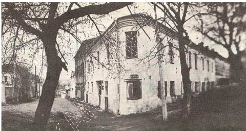
Дом на рагу вуліцы Герцэна і Музычнага завулка. Фота 1979 г.

забудову горада. Галоўная звернута на Верхні горад. Тут вуліцы і пачалася метадычная Верхняга горада, калі пазнейшых планах горада, прыкметах, дайшла да нас без выключаяецца, што асноўныя магчыма, з канца XIV—XV ст.