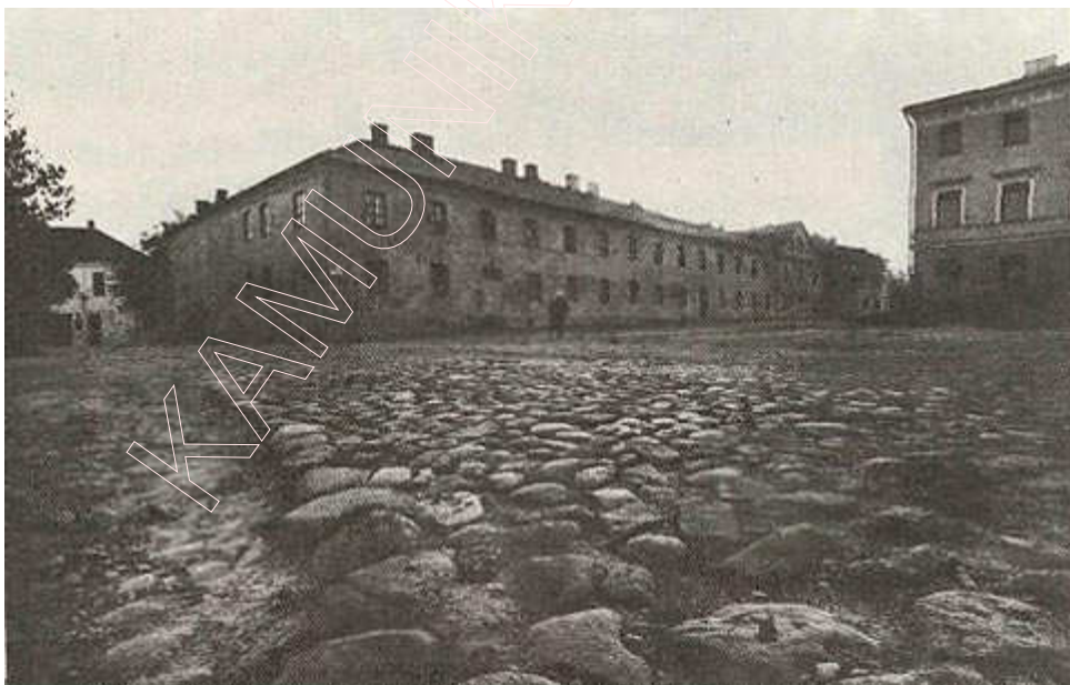
Будынак былога кляштара базыльянак на плошчы Свабоды (XVII ст.). Фота 1979 г.