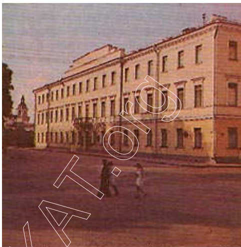
Будынак былога базыльянскага кляштара (XVII–XIX стст.) Фота 1978г

адзіны архітэктурны комплекс з царквой Святога духа. З правага пабудовы мужчынскага кляштара,