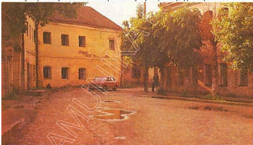
Вуліца Камунальная Набрэжная ў Троіцкім прадмесці. Фота 1976 г.

Згодна з дакументамі і сведчаннямі сучаснікаў, да самага пачатку XVII ст. Мінск быў драўляны. Спробы пабудаваць мураваную царкву на Замчышчы ў старажытным Мінску назіраліся яшчэ ў канцы XI — пачатку XII ст. Тым больш, што ў Беларусі спрадвек існавалі глыбокія традыцыі мураванай культавай архітэктуры.