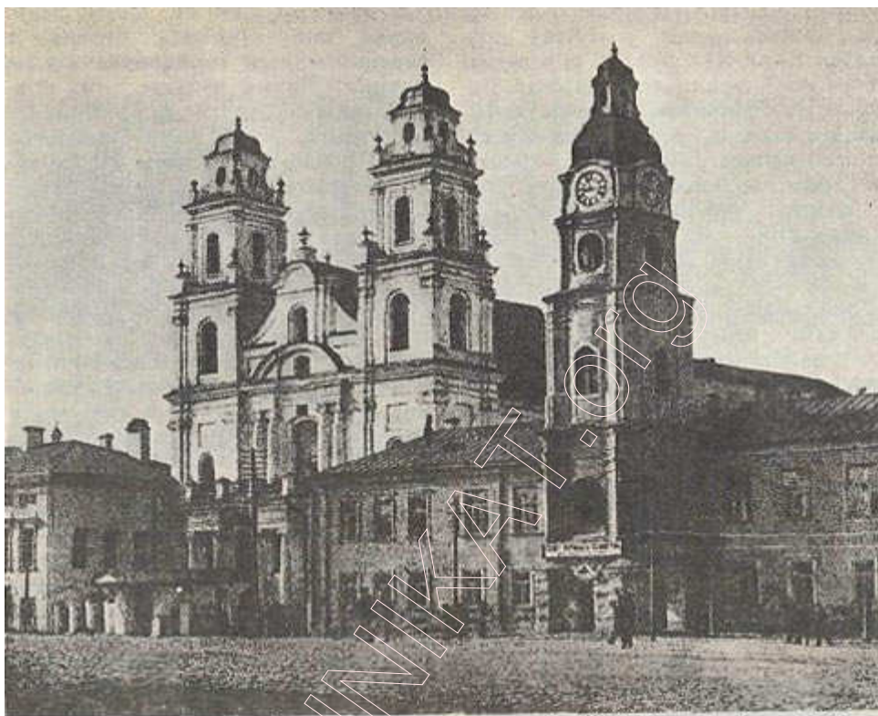
Архітэктурны комплекс езуітаў (XVIII ст.). Фота 1928 г.

плошчы Высокага рынку і большую частку тэрыторыі па левым баку вуліцы Койданаўскай да перасячэння яе з Феліцыянскай. Будынкi езуітаў былі адны з самых капіталных у горадзе. У XIX ст. у іх размяшчаліся дом губернатара, дом віцэ-губернатара і розныя губернскія ўстановы. Пасля ўтварэння БССР тут знаходзіліся розныя дзяржаўныя ўстановы. Гарадская вежа — помнік барока сярэдзіны XVIII ст. — зараз не існуе. Кафедральны касцёл часткова перабудаваны ў 1951 г. Цяпер у ім размешчана спартыўнае таварыства «Спартак».