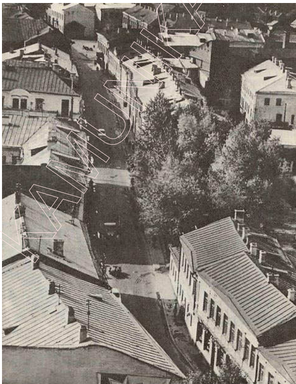
Вуліца Няміга. Фота 1967 г.

Тут жа, непадалёку ад Нізкага рынку, направа ад левага берага рэчкі Нямігі, на захад ад Мінска, пачыналася дарога на Ракаў (Ракаўскі тракт). Паступова па дарозе ўзнікла вуліца. Яна існавала ўжо ў XVI ст. і называлася Ракаўскай. Цяпер гэта вуліца імя М. Астроўскага. У 1975 г. пачалася яе перабудова.