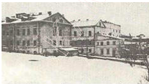
Месца, якое ў старажытнасці называлася «Валокі полацкія».

Вуліца Зыбіцкая (з XIX ст. Гандлёвая) пачыналася непасрэдна з плошчы Нізкага рынку і праходзіла на паўднёвы ўсход уздоўж правага берага Свіслачы ля падножжа ўзгорка Верхняга горада. Траса вуліцы злучала Нізкі рынак з мясцінай, якая называлася «Валокі полацкія». Прыблізна ў пачатку XVII ст. гэта месца пачало забудовацца і тут утварылася вуліца Валоцкая. У XIX ст. яна была перайменавана ў Храшчэнскую, пасля ўтварэння БССР — у Кастрычніцкую, пасля 1950 г.— у Інтэрнацыянальную (маецца на ўвазе адрэзак вуліцы Інтэрнацыянальнай ад вуліцы Янкі Купалы да перакрывавання з вуліцай Энгельса).