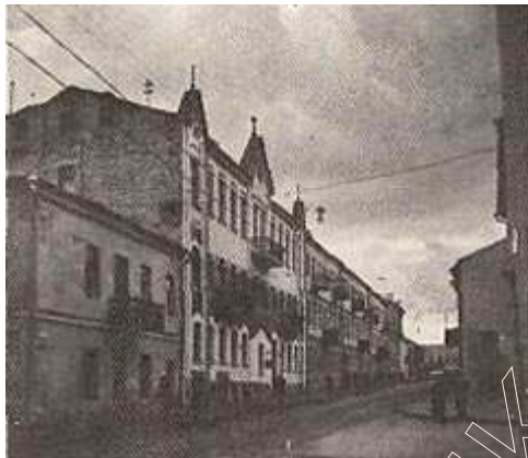
Вуліца Інтэрнацыянальная (былая Зборавая). Фота 1969 г.

Існуе меркаванне, што да XVII ст. інтэнсіўнае будаўніцтва на Высокім рынку стрымлівалася з-за адсутнасці ўмацаванняў. У пачатку XVII ст. горад у новых сваіх межах быў абгароджаны