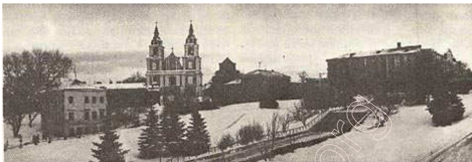
Від на Верхні горад ад Замчышча. Фота 1984 г.

У другой палове XVI ст. у сярэднявечным Мінску гістарычна вызначыліся пяць асноўных функцыянальна абумоўленых раёнаў забудовы: Замчышча, Нізкі (альбо Стары) рынак, Высокі рынак (альбо Верхні горад), Троіцкае і Татарскае (альбо Ракаўскае) прадмесці. Пазней раён Нізкага рынку называўся яшчэ Старым (альбо Нізкім) горадам. Верхні горад размешчаны там, дзе плошча Свабоды, вуліцы Бакуніна, Герцэна, Дзям'яна Беднага, Музычны завулак, Інтэрнацыянальная, Рэвалюцыйная, Камсамольская і частка вуліцы Энгельса, што прымыкае да плошчы Свабоды. Троіцкае прадмесце знаходзіцца на левым беразе Свіслачы (раён вуліц Старавіленскай, Горкага, Янкі Купалы, Камунальнай Набярэжнай). Забудова і культурны слой Татарскага (Ракаўскага) прадмесця часткова захаваліся ў раёне вуліц Астроўскага, Вызвалення, Дзімітрава, а таксама на месцы, дзе цяпер Дом кнігі і гасцініца «Юбілейная». Мінскае Замчышча існавала ў раёне цяперашняй плошчы 8-га Сакавіка. На яго тэрыторыі размешчаны зараз магазін «Алеся», гастронам, жылыя дамы, дом спорту таварыства «Працоўныя рэзервы»; праходзіць праспект Машэрава. Тут захаваліся рэшткі культурнага слоя Замчышча. Помнік гэты ахоўваецца законам і мае велізарнае значэнне для навукі.