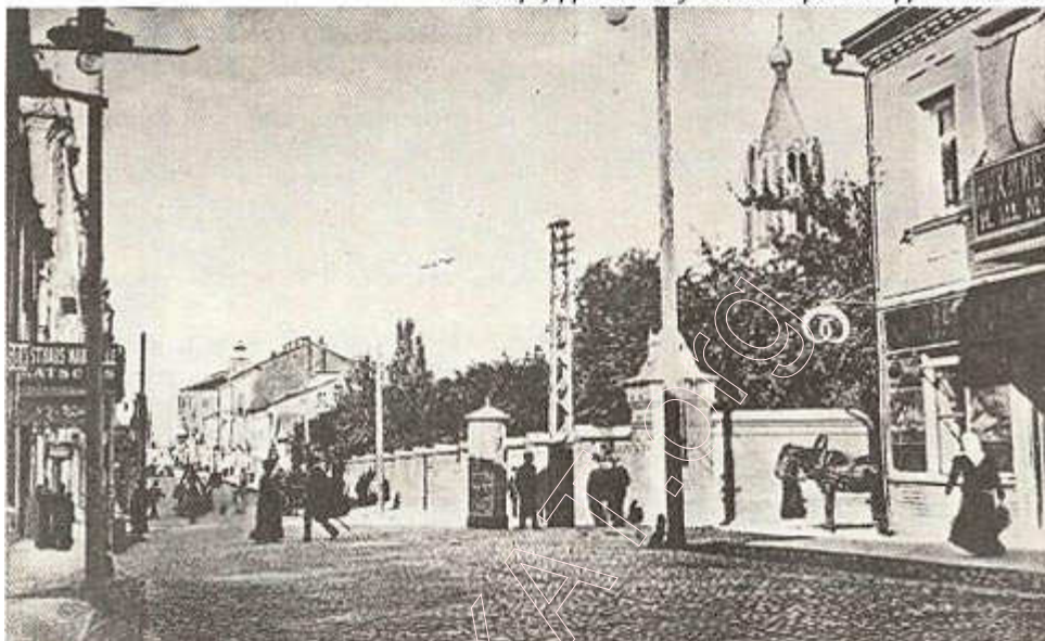
Месца, дзе стаяў кляштар бенедыктынак.

Такім чынам, у першай палове XVII ст. пабудавана большасць мураваных культавых пабудоў і кляштароў Мінска. Але, акрамя царкоўна-манастырскага, на працягу ўсяго XVII ст. у горадзе і асабліва на Высокім рынку метадычна вялося мураванае цывільнае будаўніцтва (асабнякі і крамы). Вядома, напрыклад, што ў 1654 г. князь Геранім Сангушка купіў вялікі мураваны дом на рагу вуліцы Койданаўскай і Высокага рынку. Вялікая мураванка, размешчаная ў гэтым месцы, належала таксама ў сярэдзіне XVII ст. багатаму гараджаніну. Па сведчанню чэха Б. Танера (1678), галоўным упрыгожаннем плошчы Высокага рынку была ратуша, якая стаяла ў сярэдзіне ў акружэнні мноства крам.