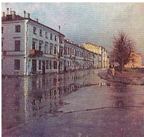
Вуліца Інтэрнацыянальная (былая Валоцкая).

Заходняя частка вуліцы Ракаўскай злучалася з вуліцай Нямігай Ракаўскім завулкам. У XIX ст. завулак перайменаваны ў вуліцу Уваскрасенскую, пасля ўтварэння БССР — у вуліцу Віцебскую. У 1972 і пачатку 1980-х гг., у час рэканструкцыі вуліцы, амаль поўнасю страчана яе гістарычная забудова.