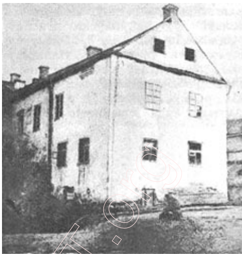
Будынак XVII ст. на былой Юраўскай вуліцы. Фота 1920-х гг.

яго пашыралі і апякалі мясцовыя магнаты, многія гараджане. Галоўнай святыняй Мінска, на якую сыпаліся фундацыі апекуноў і прыхільнікаў, у той час быў кальвінісцкі збор на памянёнай Зборавай вуліцы. Але неўзабаве становішча рэзка перамянілася. З 1596 г., пасля уніі каталіцкай і праваслаўнай царкваў, уніаты, як і католікі, атрымалі дзяржаўныя прывілеі і розныя выгады. У другой палове XVII ст. з трынаццаці мінскіх кляштароў праваслаўным застаўся толькі Петрапаўлаўскі. Распаўсюджванне уніяцтва ў Мінску сустрэла не толькі прыхільнікаў, але і праціўнікаў у абліччы многіх старэйшых праваслаўных беларускіх родаў, шляхты і гараджан. Актывізуецца дзейнасць правалаўных брацтваў. І з аднаго і з другога боку пішуцца скаргі «яго каралеўскай міласці», гучаць пропаведзі і выступленні, арганізуюцца друкарні, выпускаюцца кнігі, збіраюцца сродкі, ахвяруюцца фондушы на будаўніцтва кляштароў і святынь. Пры падтрымцы актыўных фундатараў і розных грамадскіх слаёў перабудоўваюцца старыя драўляныя кляштары на мураваныя; узнікаюць новыя. Прытым і уніаты, і католікі, і праваслаўныя імкнуліся засведчыць сваю сілу і прысутнасць у горадзе шляхам пабудовы манументальных мураваных храмаў і манастыроў. Ідэйнае саперніцтва стымулявала мураванае будаўніцтва.