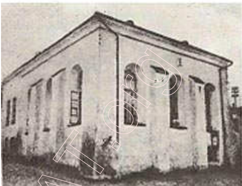
Будынак былой «Халоднай сіднагі» на Нямізе. Фота 1928 г.

Факты сведчаць, што ў XVII ст. грамадзянскае мураванае будаўніцтва ў Мінску было ўжо даволі распаўсюджана і развівалася не толькі ў цэнтры, але і ў Троіцкім прадмесці і ў іншых месцах горада.