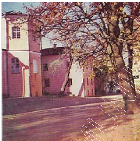
Вуліца Бакуніна (былая Вялікая Бернардынская). Фота 1981 г.

Бернардынцы займалі цэлы квартал паміж вуліцамі Вялікай і Малой Бернардынскімі, плошчай Высокага рынку і вуліцай Зыбіцкай. Капітальны комплекс, пабудаваны ў стылі барока, захаваўся да нашага часу. Касцёл арыентаваны галоўным фасадам на вуліцу Вялікую Бернардынскую (сёння вуліца Бакуніна). У 1868 г. бернардынскі кляштар быў зачынены, яго памяшканні і касцёл перададзены пад архівы. Верагодна, у гэты час быў знішчаны барочны фронтон на фасадзе; высокая канструкцыя даху заменена нізкай. У 1981 г. пачалася рэстаўрацыя гэтага помніка ў тым выглядзе, у якім ён існаваў у XVII— XVIII стст. Цяпер у будынку бернардынскага касцёла