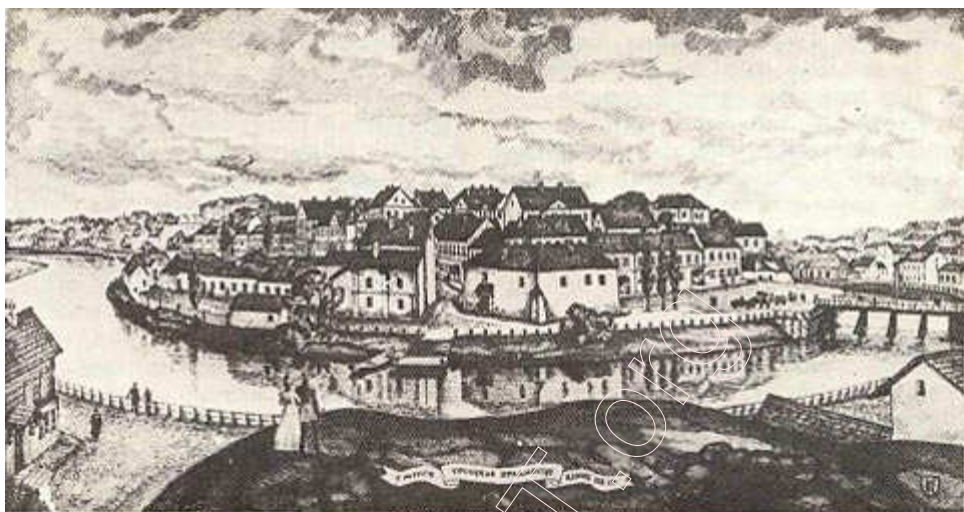
Троіцкае прадмесце ў канцы XIX ст. (рэканструкцыя і малюнак В. Сташчанюка).

Галоўнай вуліцай Троіцкага прадмесця была Вялікая Барысаўская. Яна ўзнікла на старым Барысаўскім тракце (адрэзак ад Свіслачы да 2-й клінічнай бальніцы). Працяг яе — вуліца Троіцкая. У XIX ст. перайменавана ў Аляксандраўскую. Цяпер гэта вуліца М. Горкага. Існавалі тут таксама вуліцы Зазыбіцкая, Магілёўская, Лошыцкая. Крыху пазней па старой віленскай дарозе сфарміравалася вуліца Старавіленская. З другой паловы XVI ст. у Троіцкім прадмесці існаваў Троіцкі рынак з гандлёвай плошчай. Аднак гэта месца ў XVII ст. мела перыферыйнае значэнне ў будаўнічай і сацыяльнай структуры горада.