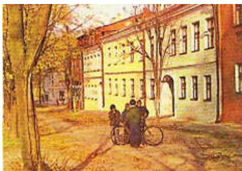
Вуліца Старавіленская ў Троіцкім прадмесці. Фота 1980 г.

Беларускі гісторык мастацтва Мікола Шчакацін, спасылаючыся на старадаўнія мінскія акты і на вядомае сведчанне Аляксандра Гваньіні (другая палова XVI ст.), лічыў, што Мінск да XVII ст. быў «выключна драўляным», бо ні ў адным дакуменце не ўжываецца слова «мураваць». Усюды гаворыцца аб «збудаванні».