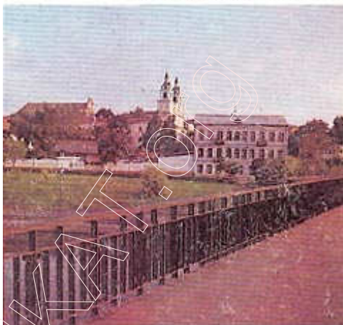
Тут быў «Хлусаў мост».

З даўніх часоў жылі людзі на левым беразе Свіслачы, насупраць замка і Нізкага рынку. З матэрыялаў раскопак, праведзеных у 1976 г. Г. В. Штыхавым і В. Е. Собалем, можна зрабіць выснову, што культурнае жыццё тут існавала з канца XII ст. Вышэй на Троіцкай гары (цяпер тэрыторыя 2-й клінічнай бальніцы і Вялікага тэатра оперы і балета) з XIV ст. існавалі Увазнясенскі манастыр і царква. Да пачатку XVII ст. на адхоне Троіцкай гары ўжо існавалі цэлыя кварталы забудовы, якія злучаліся з Нізкім рынкам праз так званы Хлусаў мост, што быў насупраць вуліцы Нямігі. На гэтым месцы пабудаваны цяперашні бетонны мост.