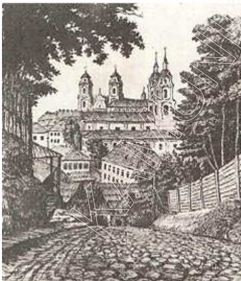
Від на Верхні горад з Троіцкага прадмесця (малюнак Я. Драздовіча, 1920 г.).

З пачатку XIX ст. Мінск рэгулярна забудоўваецца згодна з перспектыўным горадабудаўнічым планам. Новыя вуліцы былі пракладзены на поўдзень ад Верхняга горада. Праз увесь паўднёвы бок Мінска, аж да вёскі Камароўкі, пралягла вуліца Захар'еўская (да вайны Савецкая, цяпер Ленінскі праспект). У сярэдзіне XIX ст. пачалі забудоўвацца мураванымі дамамі вуліцы Падгорная (К. Маркса), Магазінная (Кірава), Шпітальная (Фрунзе) і інш. На месцы цяперашняга сквера Янкі Купалы ў пачатку XIX ст. узнікла гандлёвая плошча. Яе і