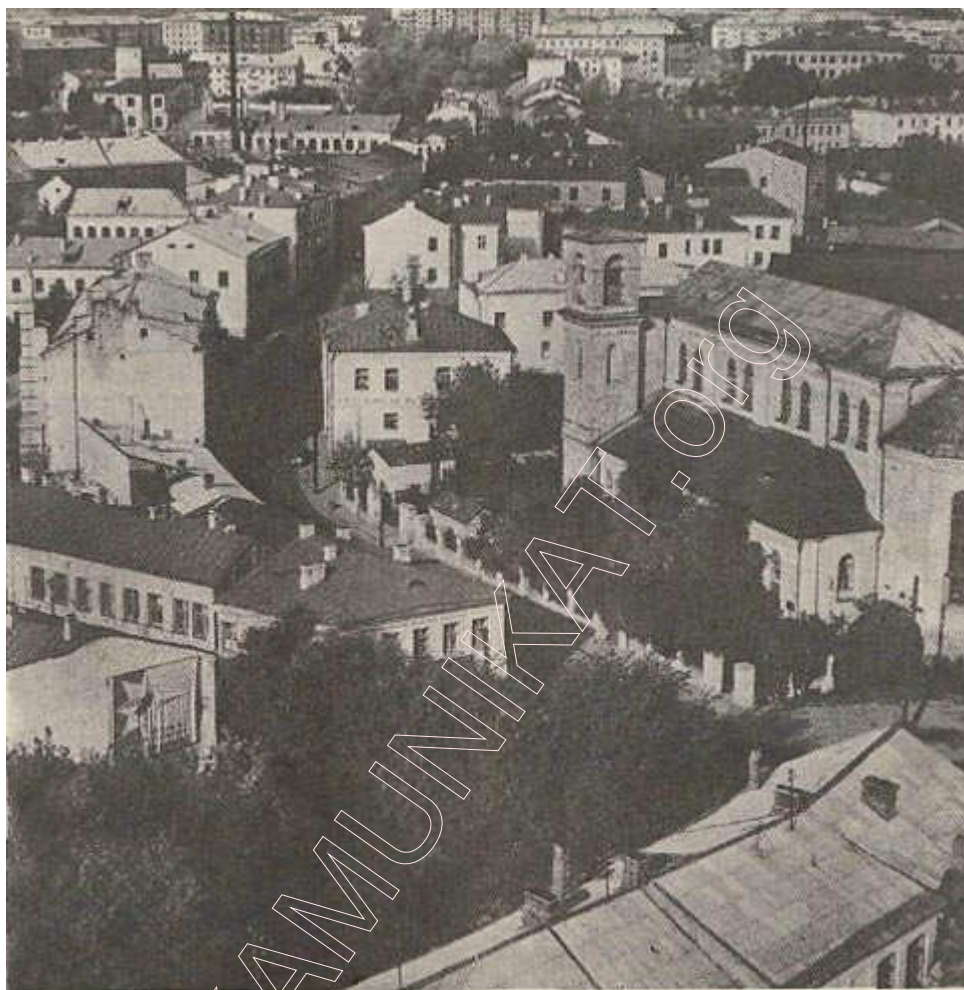
Вуліца Астроўскага (былая Ракаўская). Фота 1967 г.

У выніку рэканструкцыі знесены забудовы XVII — XVIII стст., што прымыкалі да Петрапаўлаўскай царквы.