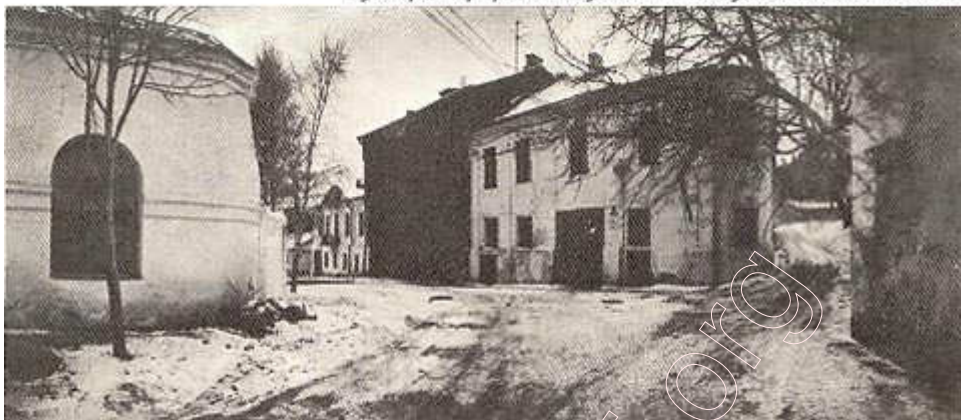
Вуліца Герцэна і Музычны завулак. Фота 1984 г.