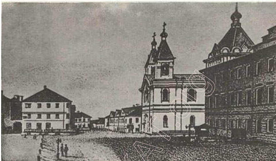
Будынкi на Саборнай плошчы (малюнак сярэдзіны XIX ст.).