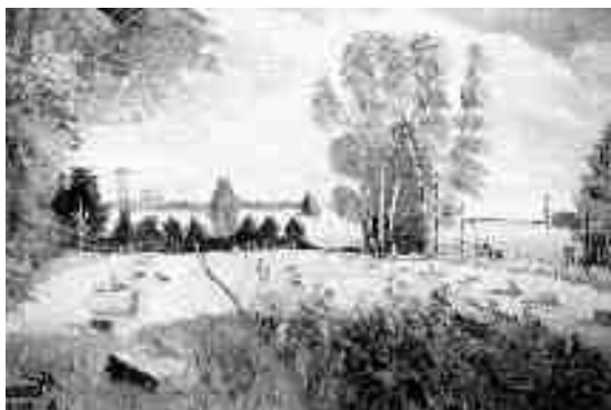
198. Uroczysko Smolanka , obraz olejny na płótnie Anatola Krawczuka

Magazýnisko ( Магазыніско ) – miejsce, na południe od wsi, gdzie stał spichlerz gromadzki