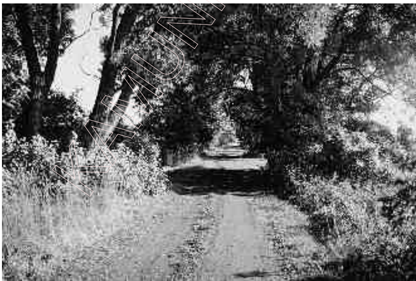
199. Aleja, prowadząca do byłego dworu Dzięciółowo

Dwuorszczyna (Двуоршчына) – grunty dawnego majątku Dzięcióło-