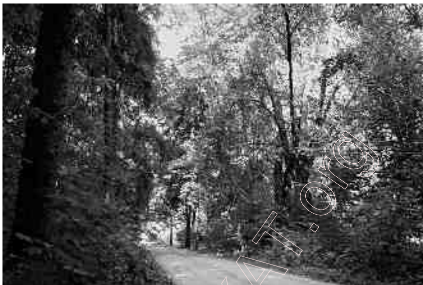
196. Pańska Doroha , prowadząca przez las kazionny koło Hołodów

w tym miejscu grzebano padłe zwierzęta gospodarskie