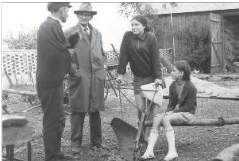
Этнаграфічная экспэдыцыя на Беласточчыну. 60-ыя гг.

стварэнні Беларускага музэю ў Белавежы. Падчас сваіх экспэдыцыяў па Беласточчыне ён сабраў нямала каштоўных экспанатаў, якія ў дагэтуль сьманструюць у Торуньскім этнаграфічным музэі беларускую народную культуру.