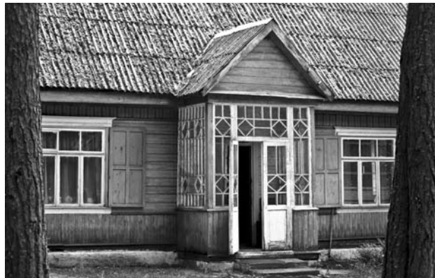
Дача Максіма Танка на Нарачы.

На Мядзельшчыне ён з'явіўся, З Радзімай ляс свой паяднаў. Для новых вершаў нарадзіўся І светлы шлях сабе абраў.