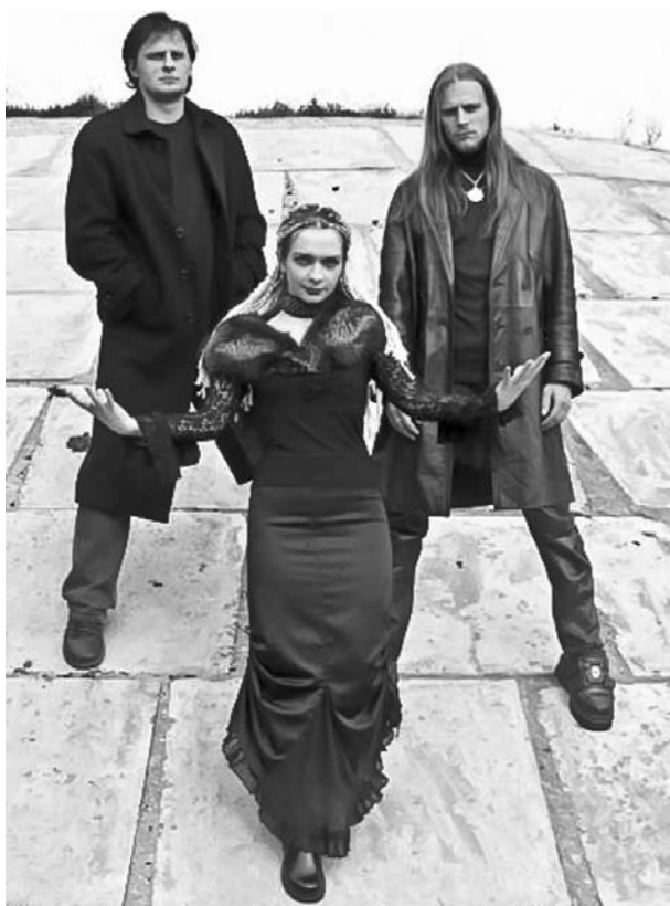
Груп Dialectic Soul

«Сымон-Музыка» і «Родны край». Тут вы на першых дваццаці секундах адчуваеце жывую цеплыню настрою, якая плаўна, нават з украпленнямі духавых, навёрствае гітарным драйвам нястрыманую энергетыку: