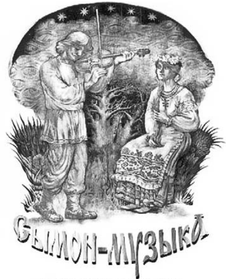
Музычны праект паводле апаэмы Якуба Коласа

Адразу варта адзначыць дзівацтва музыкаў, якія на самім альбоме нідзе не напісалі «Dialectic Soul», хоць пачынаецца ён з таго самага мега-хіта «Сымон-музыка» 2004 года. Дый фота ў буклеце, рэестр удзельнікаў падказваюць, што гэта якраз тыя, каго чакалі. Навошта такая таямнічасць? Тлумачыць гітарыст і клавешнік гурта Вячаслаў Знахарэнка: «“Сымон-музыка” — гэта назва праекта музыкаў гурта «Dialectic Soul», якія самі не хочуць, каб у слухачоў былі асацыяцыі з прывычным іміджам. Другі дыск адпаведна будзе мець назву “Сымон-музыка. Частка 2”, але ў планах — прывабіць музыкаў з іншых калектываў, ужо вядуцца перамовы».