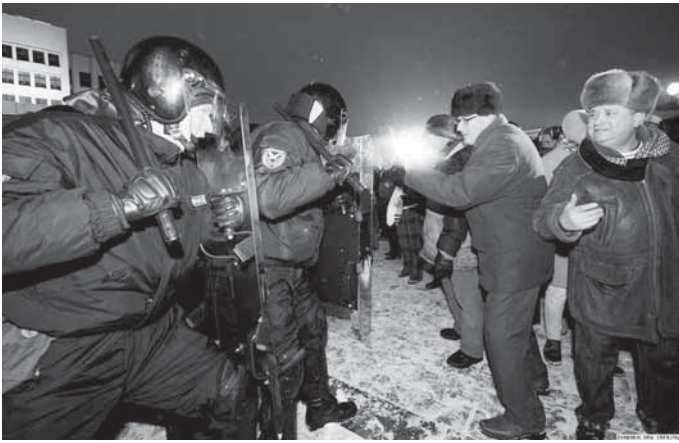
Збівалі мірных удзельнікаў, старыкоў, жанчын, дзяцей