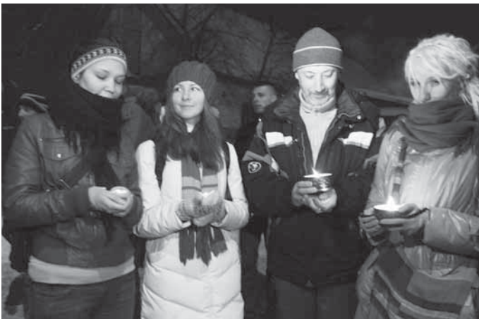
Акцыя салідарнасці з затрыманымі праходзяць у Беларусі амаль кожны дзень