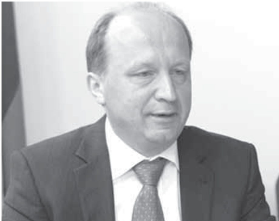
Прэм'ер-міністр Літвы Андрус Кубіліюс

На сустрэчах з міністрам замежных спраў Літвы Вігаўдасам Ушацкасам і прэм'ер-міністрам Андрусам Кубілюсам гаворка вялася пра наяўнасць у Беларусі палітвязняў, нерэгістрацыю БХД, праблемы дэмакратызацыі краіны, паведаміў прэсавай службе партыі лідэр БХД Павал Севярынец.