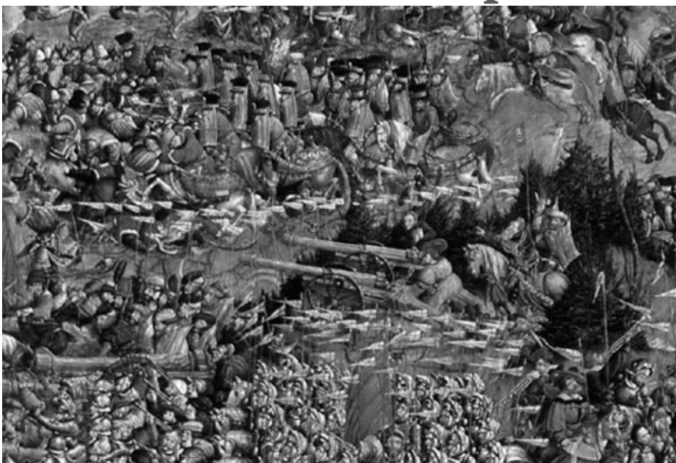
Frahment karciny “Bitva pad Voršaŭ”

Adbyłasia evalucyja i ź hierbam. Vyjava hierbu časou Połackaha kniaŭstva, Vialikaha kniaŭstva Litoŭskaha, Bielaruskaj Narodnaj Respubliki ŭvieś čas mianiałasia. Zastavaŭsia duch, sutnaść – zbrojny rycar na kani. Ale forma miača, ŭzbrajennia rycara, pastava kania ŭvieś čas mianiałasia: to koŭ skakaŭ naŭskač, to