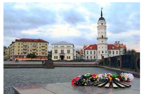
г.Магілёў, Савецкая плошча