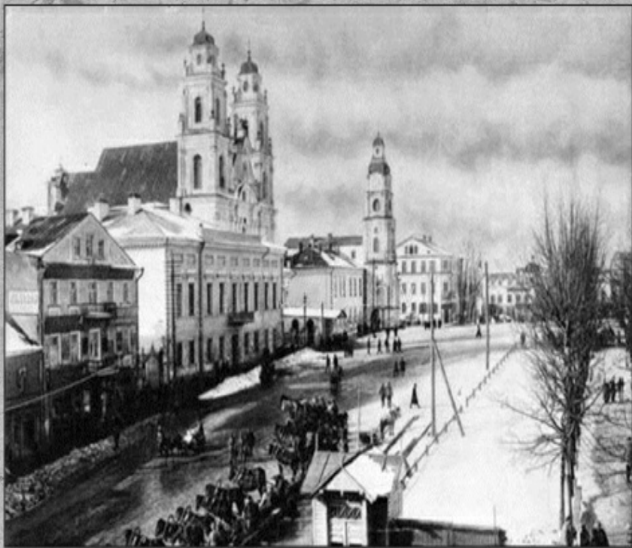
Народны камісарыят асветы, дзе з 1922 г. да сярэдзіны 1930-х гг. знаходзіўся Галоўлітбел (трохпавярховы будынак за вежай езуіцкага калегіума)