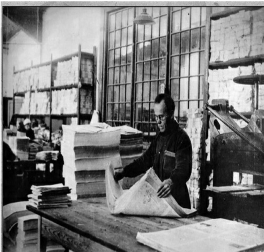
Праверка газетнага тыражу ў друкарні. 1930-я гг.