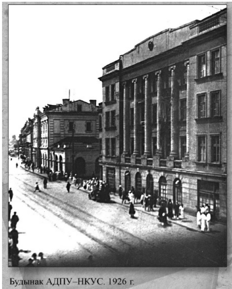
Будынак АДПУ–НКУС. 1926 г.