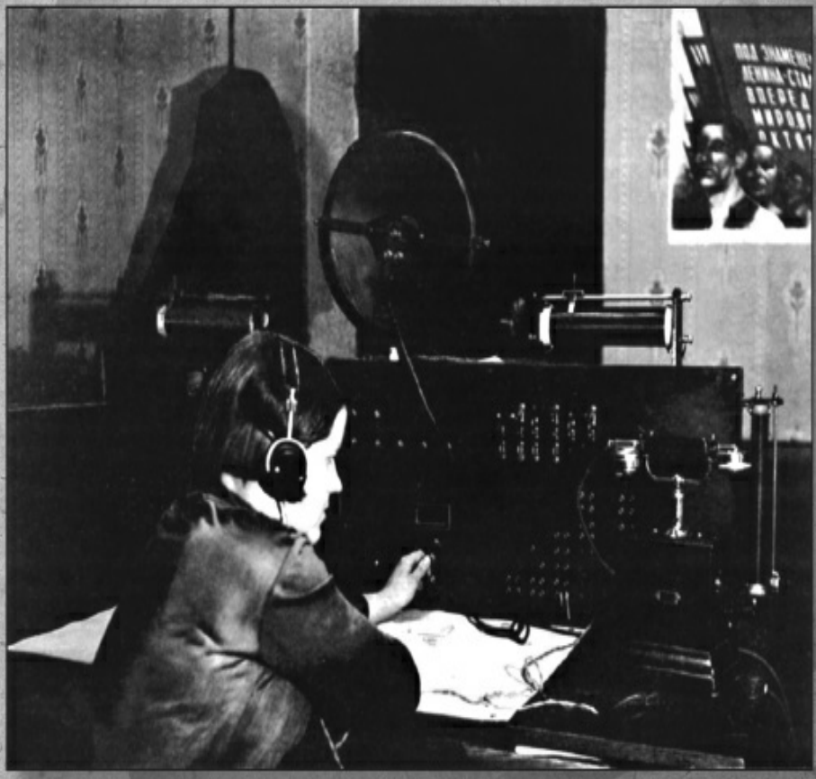
Станцыя кантролю якасці ў Белрадыёцэнтры. 1930-я гг.