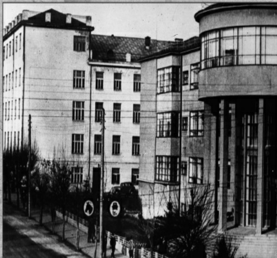
Будынак ЦК КП(б)Б. 1932 г.