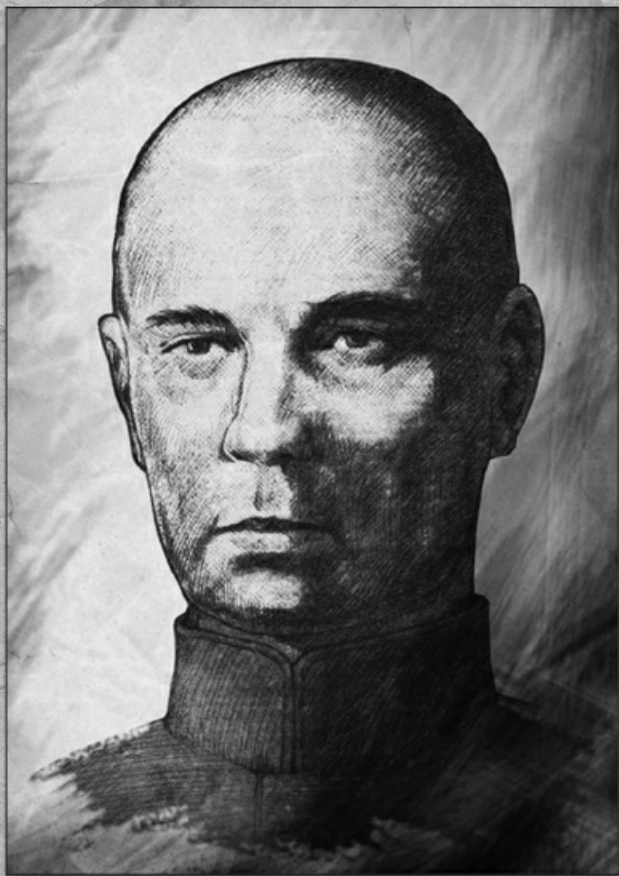
Р. К. Шукевич-Трацякоў. Пачатак 1920-х гг.