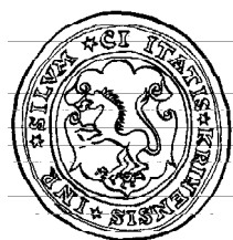
3. Рэканструкцыя пячаткі места Крынкі (1640).

(Мал. 3). У сувязі з гэтым, малюнак герба Крынак патрабуе выпраўлення.