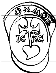
2. Рэканструкцыя пячаткі праваслаўнага Наваградскага манастыра (1636).

Прадстаўлены і ахарактарызаваны на с. 177 Анатолям Цітовым герб Крынак мае ў сабе істотную памылку ў паставе ільва на тарчы. Леў у геральдыцы звычайна маляваўся ў профіль, стаячым на задніх лапах з узнятымі пярэднімі лапамі 8 . Менавіта такім ён быў на пячатцы Крынак з дакумента (1640 г.), пададзенага Анатолям Цітовым. Але кепская захаванасць адбітка ўвяла ў зман даследчыка. У фондах Гродзенскага гісторыка-археалагічнага музея захоўваецца яшчэ адзін дакумент таксама з 1640 г., на якім захаваўся больш выразны адбітак. На справе крынкаўскіх мяшчан Каспера Лаўрыновіча і яго жонкі Ганны Лупнеўскай мы бачым на тарчы ўзнятага ільва, скіраванага ўправа 9 .