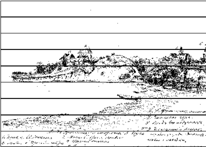
Драгічын з боку Заходняга Буга, малюнак алоўкам, 1887 г., аўтар невядомы. Архіў Інстытута гісторыі матэрыяльнай культуры Расійскай акадэміі навук у Санкт-Пецярбургу, ф. 1, 1886 г., арх. адз. 55, л. 33.

Другі хлев для свиней и протчаго съ брусевъ тонких сосновыхъ.