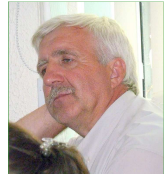
Рыгор Кастусёў слухае Купалу

Кампазітар Мікола Яцкоў у сваім выступленні зрабіў акцэнт на абставінах таго часу, калі каханне паэта трапіла пад чорныя крылы ваеннага