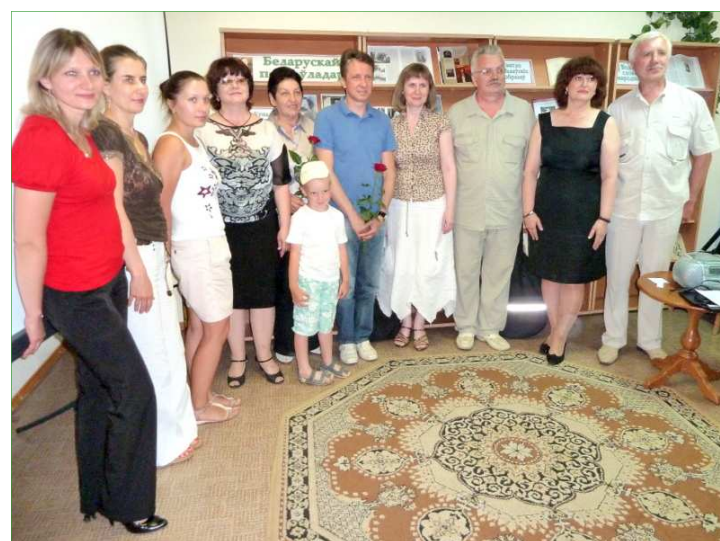
Фотаздымак на ўспамін

ліхалецця, і Купалу прыйшлося займацца пытаннямі новага беларускага войска, якое, на жаль, не ўтварылася, але свой след у гісторыі Беларусі пакінула. У тым ліку і ў выглядзе купалаўскага цыклу вершаў "На вайсковыя матывы. Песні на ваяцкі лад", музыку да якога ў наш час напісаў Мікола Яцкоў.