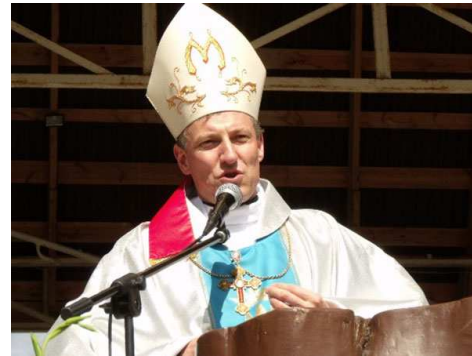
Арцыбіскуп Збігнеў Станкевіч