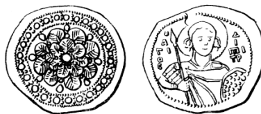
Пячаткі другога тыпу, с. 249, №№ 6, 7, 8, 9

Другі тып пячаткаў пад нумарамі 6, 7, 8, 9 7 розніцца ад першага тым, што на правым баку замест эмблемы Рурыкавічаў — шматплялёсткавая разетка. Такую эмблему маюць толькі 4 пячаткі Ізяслава Яраславіча. Абводак прыгожа аздоблены. На левым баку, як кажа В. Л. Янін, „поясное изображение св. Димитрия Солунского с копьем в правой руке и со щитом в левой”. Вакол галавы німб, па баках надпіс „агіос Дімітр”.