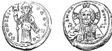
Пячатка Канстантына X Дукі

У Візантыі толькі імператары і імператрыцы мелі права на сваіх пячатках зьмяшчаць вобраз Хрыста і свой партрэт. Напрыклад, пячаткі з XI ст. імператрыцы Тэадоры (1054-1056), Канстантына X Дукі (1059-1066), Андроніка (1067), Нікіфара III (1078-1081), Аляксея I Комнена (1081-1118) 10 .