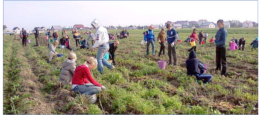
Навучэнцы Кадзінскай школы Магілёўскага раёна на ўборцы ўраджая

Існуюць два варыянты прымусовай працы - або рабочых забіра-