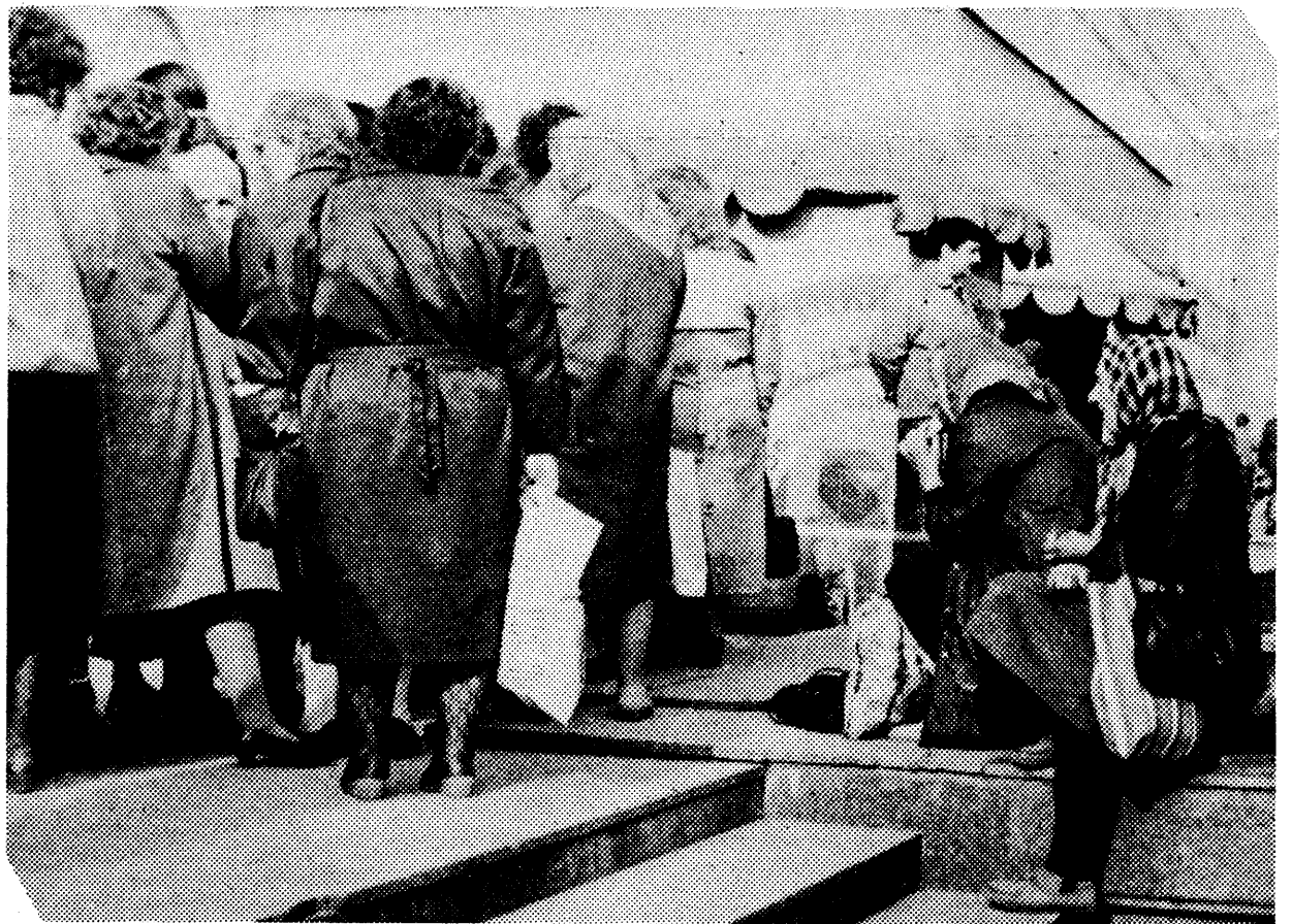
Усё жыцьцё бясконца чарга.