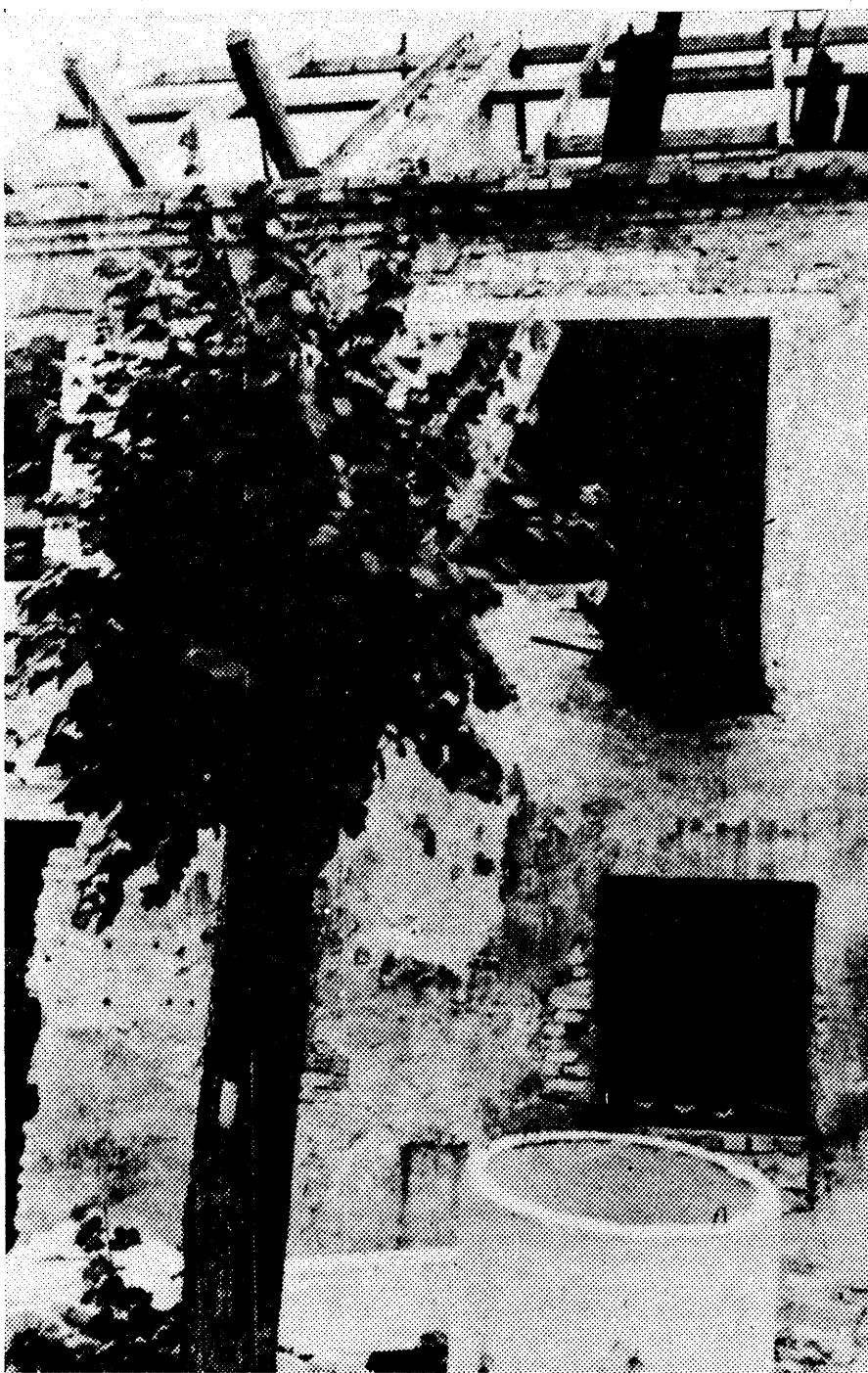
Перабудова? Аднаўляць? Будаваць занова?