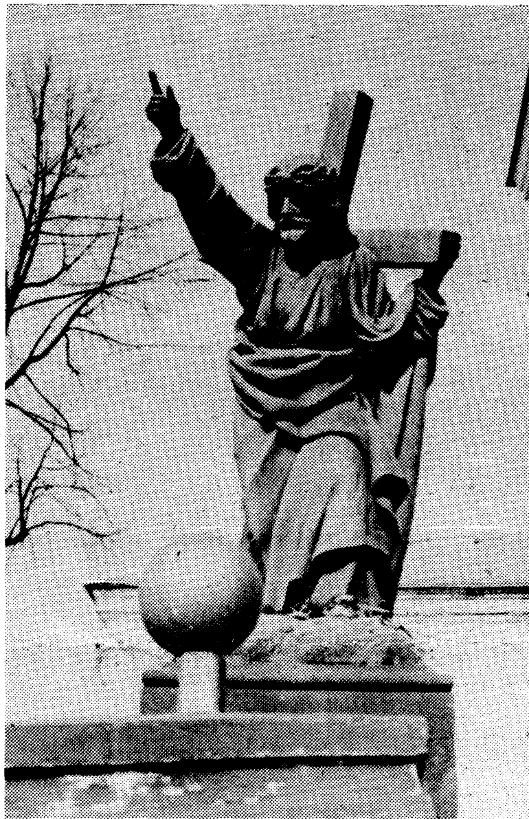
На Запад — значыцца ў Эўропу...

Разам з тым, мы разумеем, што ня толькі хлебам адзіным жывы чалавек. Няма прыкладаў у гісторыі сусьветнай цывілізацыі, каб толькі эканамічныя праблемы прыводзілі ў заняпад цэлыя дзяржавы і нацыі. А вось падобных прыкладаў, дзяржавы з упадкам маралі, стратай духоўных і культурных