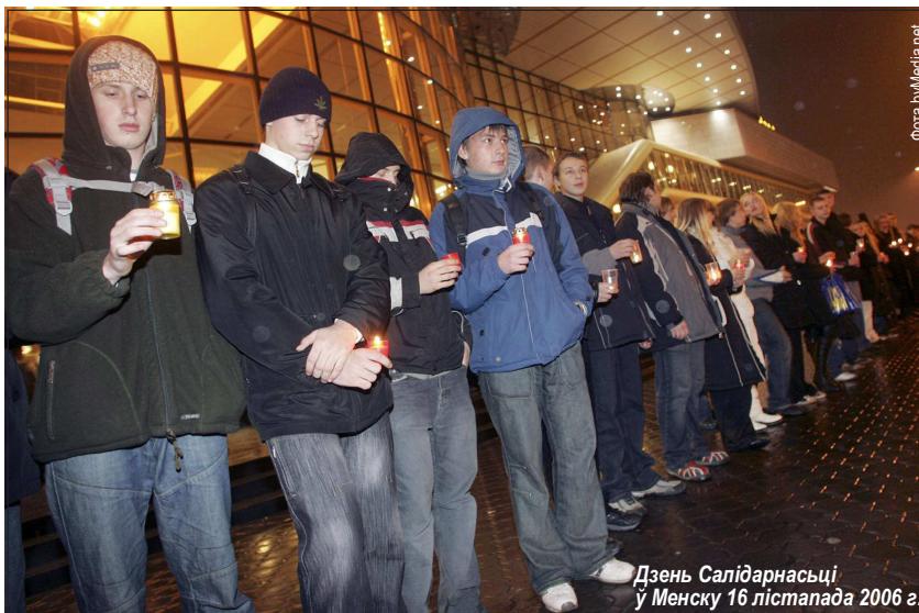
Дзень Салідарнасьці ў Менску 16 лістапада 2006 г.