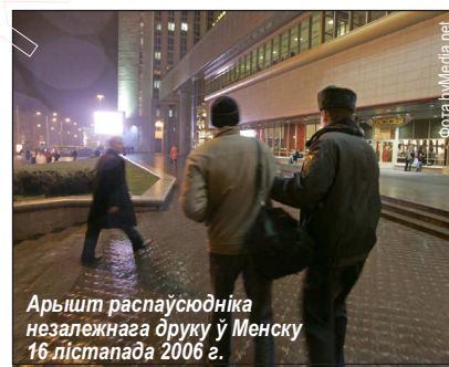
Арышт распаўсюдніка незалежнага друку ў Менску 16 лістапада 2006 г.

Нагадаем, на працягу апошніх гадоў дзяржаўныя прадпрыемствы-манапалісты "Белпошта" і "Белсаюздруку" скасавалі дамовы і адмаўляюцца супрацоўнічаць з большасьцю