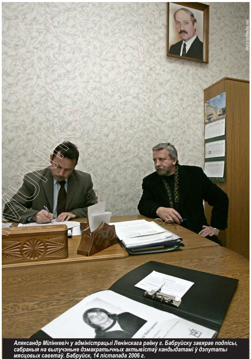
Аляксандр Мілінкевіч у адміністрацыі Ленінскага раёну г. Бабруйска заявляе подпісы, сабраныя на вылучэнне дэмакратычных актывістаў кандыдатамі ў дэпутаты мясцовых саветаў. Бабруйск, 14 лістапада 2006 г.

У самога лідэра АГП засталася толькі адна магчымасць прыняць удзел у выбарах – вылучыцца ад партыі. Верагодней за ўсё, ён будзе балатавацца па Куйбышаўскай выбарчай акрузе, дзе размешчаная штаб-кватэра АГП. У гэтай акрузе ўжо зарэгістравалі сваю ініцыятыўную групу лідэр Партыі камуністаў Беларускай Сяргей Калякін, а таксама мае намер балатавацца намеснік старшыні Партыі БНФ Віктар Івашкевіч.