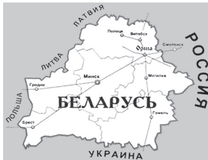
Дэмакратычныя краіны-суседзі выйграюць ва многім

Пры гэтым павялічылася колькасць тых, хто дае асобе прэзідэнта негатывную ацэнку: такое меркаванне склалася ў 22 адсоткаў рэспандэнтаў.