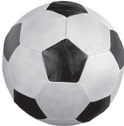
“БАТЭ” стаў большы чым футбол

— Як даўні заўзятар футбола, з тых часоў, як БАТЭ трывала стала на ногі і вылучылася сярод беларускіх каманд, я аддаю прыхільнік гэтай каманды. Думаю, што сёння ў БАТЭ шмат прыхільнікаў па ўсёй Беларусі, незалежна ад таго, маюць грады свае каманды ці не. БАТЭ, канечне, — гэта нашае свята. Гэта больш, чым падзея ў беларускім футболе. БАТЭ адыгрывае нейкую кансалідуючую ролю для беларусаў як беларусаў,