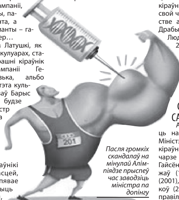
Пасля гromкіх скандалаў на мінулай Алімпіядзе прыспеў час заводзіць міністра па допінгу

Адноснае цыклічнасць назіраецца ў айчынным Міністэрстве адукацыі, кіраўнікі якога працуюць па чарзе то 2, то 7 гадоў: Віктар Гайсёнак (1992), Васіль Стражаў (1994), Пётр Брыгадзін (2001), Аляксандр Радзькоў (2003). Калі наша версія правільная, то Сяргею Мас-