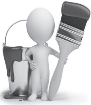
Новы міністр – адносна новай фарбы міністэрства

кевічу, прызначанаму на пасаду ў 2010 годзе, варта засцерагацца за сваё крэсла.