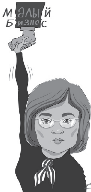
Пра падтрымку малага бізнесу больш гавораць

— Адметнасць нашай краіны ад цывілізаваных (больш правільна будзе сказаць "разважлівых") дзяржаў у тым, што ў іх план — гэта план і яны шукаюць сродкі для дасягнення пастаўленых мэт, а ў нас план — гэта закон, і хоць ты разарвіся, але дай справаздачу аб яго выкананні. Баюся, што ў нас атрымаецца «як заўсёды» (паводле вядомага выразу Чарнамырдзіна) і чыноўнікі проста пачнуць выбіваць з бізнесу паказчыкі, — лічыць эксперт. — Гэтае выбіванне адбываецца ўжо сёння: напрыклад, падаткавікі адчитваюць прадпрымальнікаў за тое, што ў іх выручка знізілася. А якая справа падаткавікам да маёй выручкі, калі ўсе падаткі я плачу своєчасова?! Бізнесменаў выклікаюць на нарады ў выканкамы, тым ці іншым чынам "выкручваюць" ім рукі, даводзяць да іх нейкія паказчыкі. Таму, баюся, павелічэнне працэнтных паказчыкаў будзе адбывацца менавіта праз