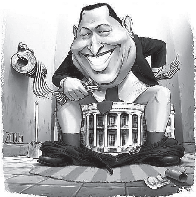
Такім бачылі Чавеса мільёны

Уга Чавес быў адным з найбліжэйшых палітычных ся- броў Аляксандра Лукашэнкі. Сышліся яны на глебе антыа- мерыканізму. Потым распа- чалі сумесны бізнес. Гістарыч- ным анекдотам застануцца пастаўкі нафты з Венесуэлы