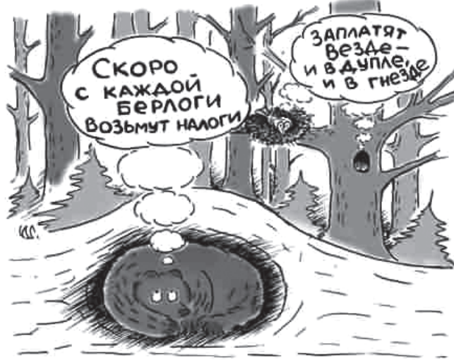
Вазьмуць і яшчэ як