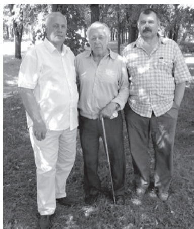
Ветераны «Коминтерна»