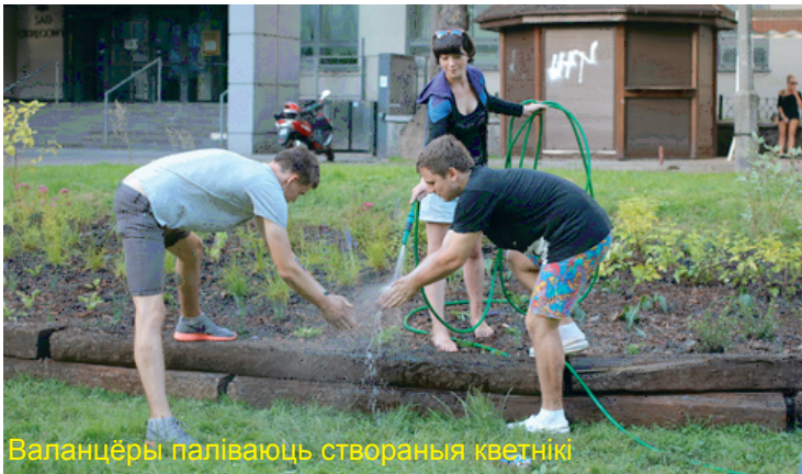
Валанцёры паліваюць створаныя кветнікі