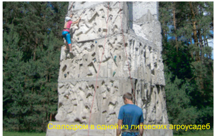
Скалодром в одной из литовских агроусадоб

На примере работы агроусадоб Вильнюсского и Каунасского районов представители Сморгонского района познакомились с работой ассоциации сельского туризма Литвы. У нас очень много общего: леса, реки, озера... Но в плане развития своих подворий соседи ушли намного вперед. Мы призываем хозяев наших агроусадоб начать работать по-новому, с определением направленности, индивидуальности каждой усадьбы, в партнерстве с другими усадьбами и мастерами. В Литве это уже достигнуто... Например, для охотников, имеется полигон, где есть возможность пострелять, поучиться. Для любителей физических нагрузок построен скалодром с различными веревочными препятствиями и многие другие спортивные сооружения. Мы сами видели, что у них нет отбоя от клиентов! Люди работают на перспективу: строят амфитеатры, вписывая их в ландшафт, проводят там концерты и местные праздники. Целые дома ремесел расположены в агроусадьбах, здесь же продают изделия, изготовленные народными мастерами. Корпоративы не основной источник доходов. Конечно, это тоже имеет место, но проводится все в