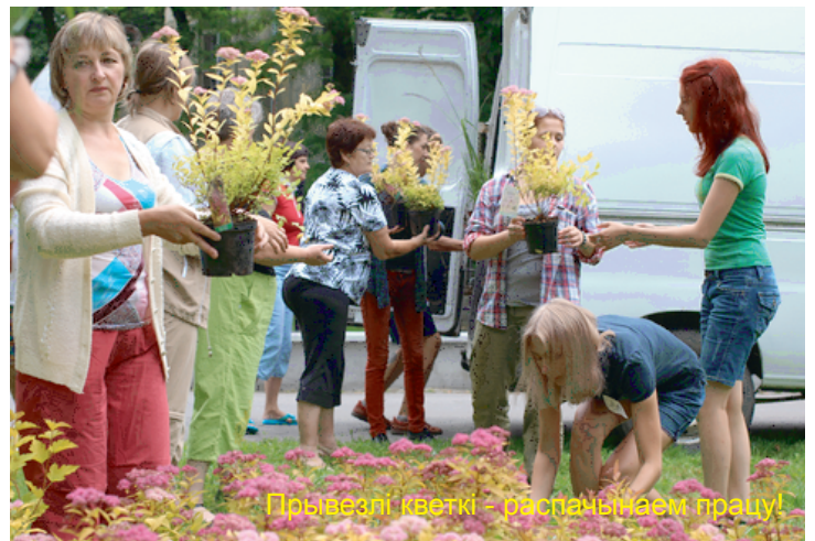
Прывезлі кветкі - распачынаем працу!

Здрава, што ў адным месцы змаглі сустрэцца такія розныя людзі! Змаглі працаваць разам, дамаўляцца, вырашаць рабочыя пытанні і ствараць нешта новае.