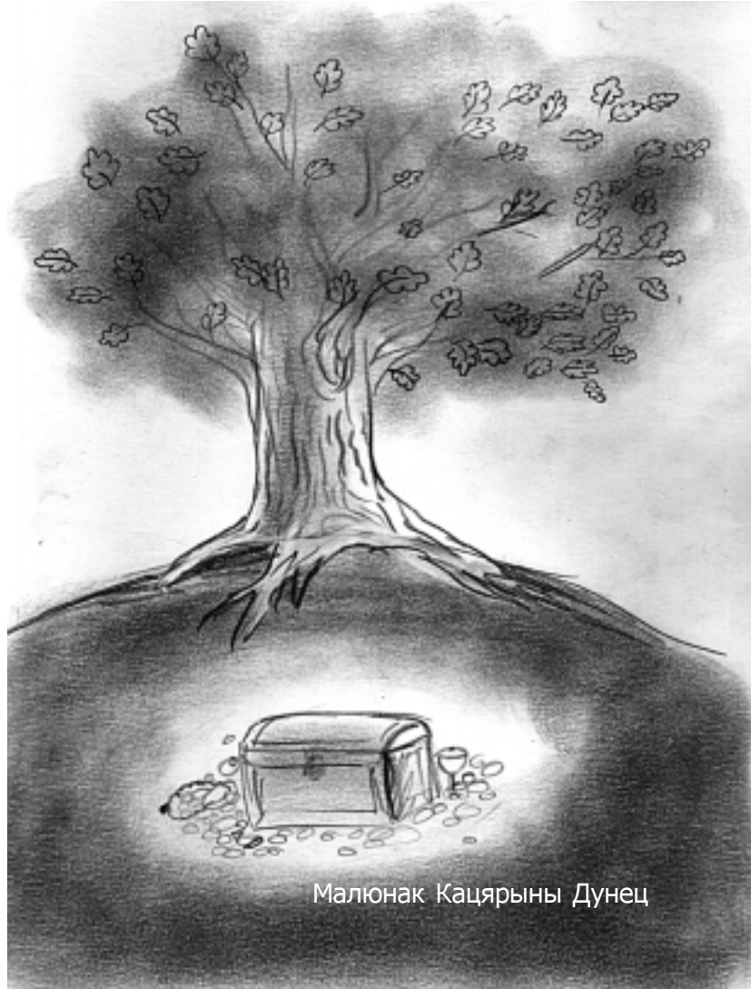
Малюнак Кацярыны Дунец

На пераездзе ўброд праз невялікую рачулку карэта загразла. Тузаліся-тузаліся