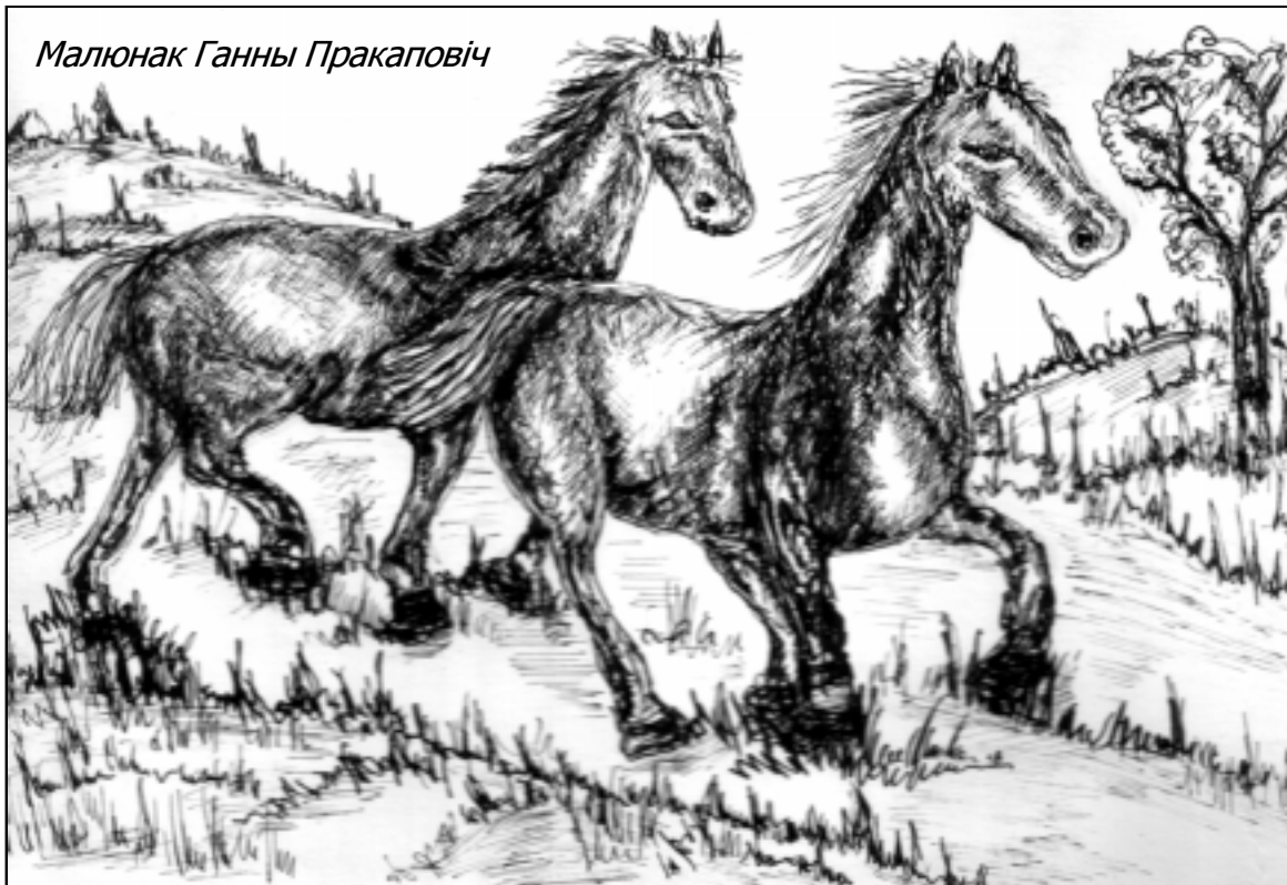
Малюнак Ганны Пракаповіч

нечаканыя здарэнні. Калі ідзеш полем, то нічога, усё як і заўсёды, а вось як увойдзеш у лясок і дарожка пачынае пятляць паміж узгоркаў, лагчын і балотцаў, то ўжо так і чакай, што нешта здарыцца. Найчасцей трапляюцца тут падарожнікам коні. Прыгожыя і дагледжаныя, з'яўляюцца яны ціха і нечакана з-за павароту, падыходзяць блізка, махаюць густымі грывамі і хвастамі, разварочваюцца, лёгка бягуць наперад,