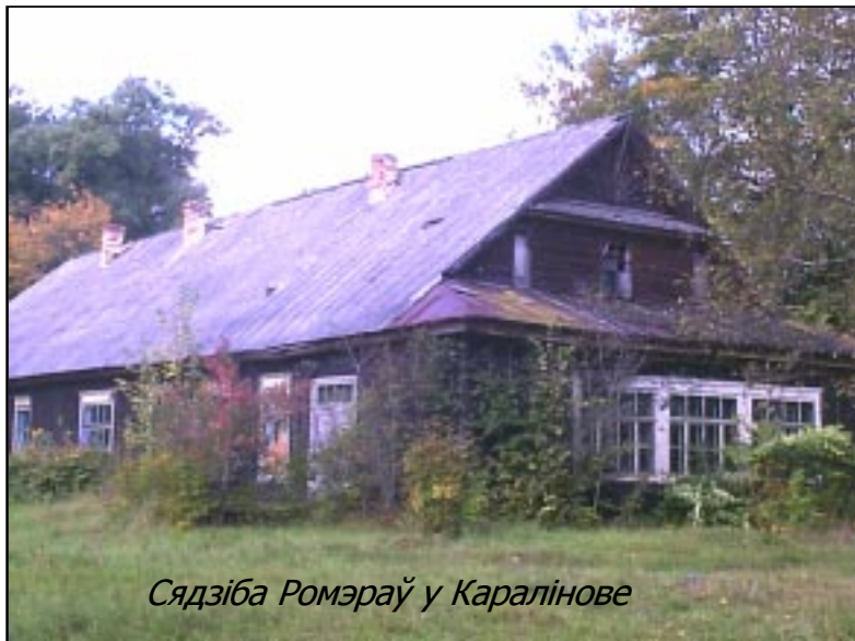
Сядзіба Ромэраў у Каралінове

у якой адлюстравалі дзве плыні тутэйшых: нацыянальных здраднікаў-прыстасаванцаў і сапраўдных свядомых патрыётаў