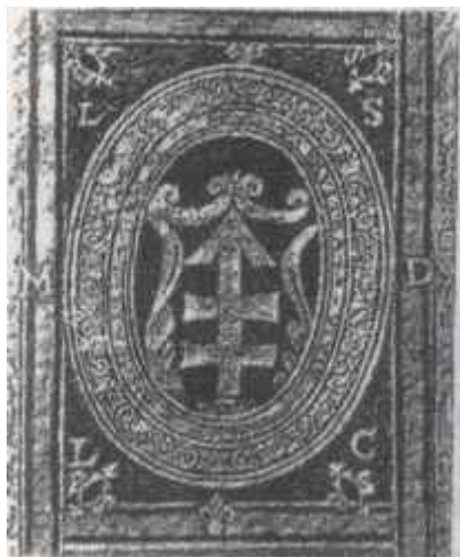
Кніжны знак Л.Сапегі. У коле на латыні змешчаны ягоны дэвіз. Каля 1600 г.