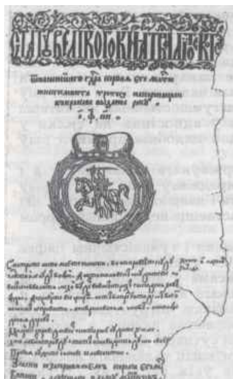
Тытульны аркуш Статута 1588 г.