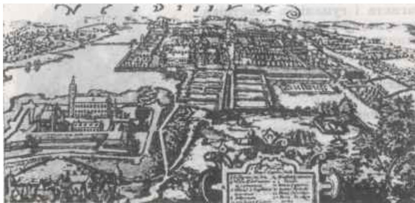
Нясвіж. Гравюра пач. XVII ст.