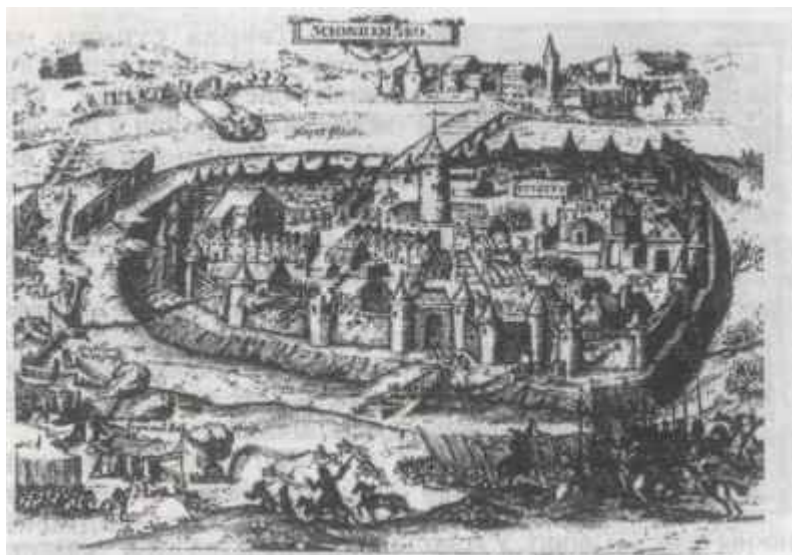
Аблога Смаленска войскам Рэчы Паспалітай. 1610 г.