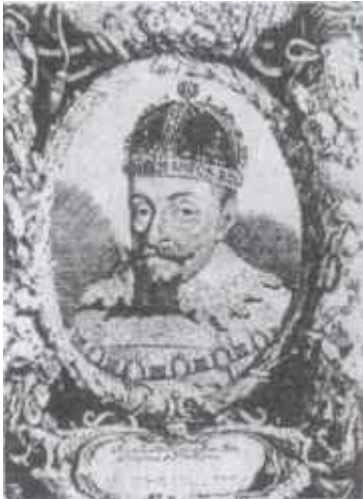
Жыгімонт III Ваза