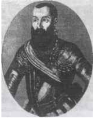
Мікалай Радзівіл Чорны