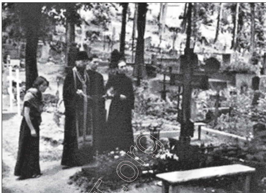
Надмагільныя крыжы абвешваюцца белымі ручнікамі, ці на крыж вешаюць невялікія вяночкі