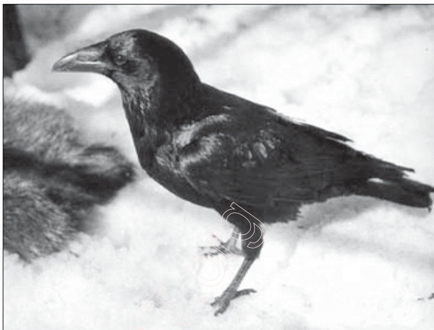
Набрав в саду полный клюв муравьёв, она смазывала этим оригинальным «кремом» свои крылья

Ручная сорока приготавливала свои ежедневные «протиранья» из смеси муравьёв с табаком. Набрав в саду полный клюв муравьёв, она ле-