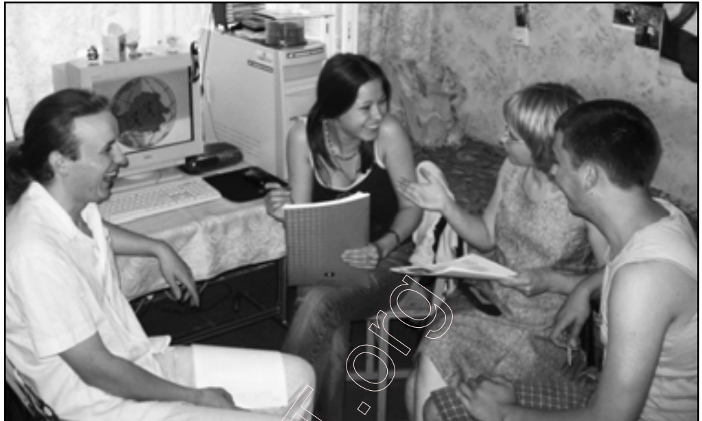
Падчас гутаркі былі і несур'ёзныя моманты

ныя вынікі вашае дзейнасці за перыяд існавання.