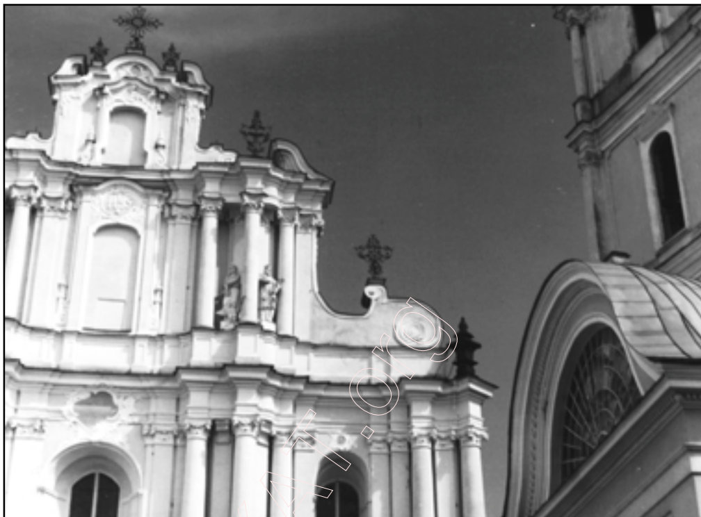
Віленская alma mater, год адкрыцця - 1579

Што тычыцца афіцыйнай часткі, Уладзімер Арлоў у сваёй кнізе “Таямніцы Полацкай гісторыі” гэтак апісвае выпускныя дні навучэнцаў Полацкага езуіцкага калегіума, які пачаў сваё існаванне 2 ліпеня 1580 года: “У езуіцкіх школах вакацыі пачыналіся звычайна першага жніўня... У той дзень Полацк мог быць сталіцаю ўсёй Белай Русі; шум і грукат вазоў адзываўся па ўсім горадзе; адны ехалі на ўрачыстасці ў дзень святога Ігнація Лаёлы; другія – каб падзякаваць за турботы тым, хто выхоўваў іх дзяцей, іншыя – “каб пабыць у тэатры”, бо вучні рыхтавалі да гэтых дзён пастаноўку...” Дарэчы, званне ўніверсітэта полац-