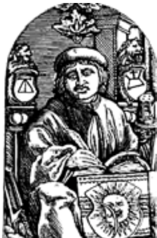
Францыск Скарына, выпуск - 1512 г

Цікавейшай з кропкі гледжання студэнцкай моладзі ўсіх часоў падаецца ўжо больш вольная ад афіцыёзу і залішняй