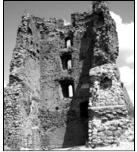
Муры Наваградскага замка

Свята вольнай беларускай паэзіі пройдзе 8 ліпеня ў наваколлі Дому-музею Янкі Купалы ля вёскі Ляўкі на Аршаншчыне. Даехаць і ад’ехаць з Мінску можна аўтобусам Орша – Копысь, які ад аўтавакзала адыходзіць у 6.30; 10.00; 13.30; 16.30. Ехаць трэба да прыпынка “Музей Янкі Купалы”, а там прайсці праз