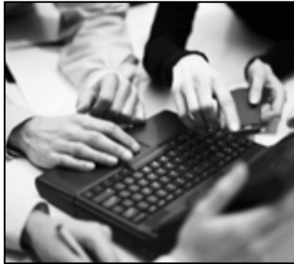
Прэзентаваць свой дыпломны праект можна было праз ноўтбук

Страхі і прагнозы не спраўдзіліся. Калі памятаеце, у заключны