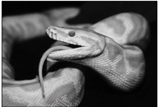
Змеі сустракаюцца і сярод людзей

Злосныя дзеянні вужоў і гадзюк, у большасці, накіраваны супраць чалавека, нават супраць таго, хто толькі што выратаваў іх ад вернай смерці. Такая сцэна сустракаецца ў беларускай народнай казцы “Як