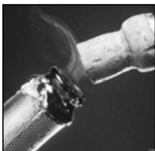
«Гэты вечар не абыдзеца без келіха добрага віна»

Выпускнікі плануець весела і запамінальна адсвяткаваць свой апошні вечар. Дзе-