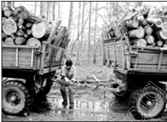
Гэтак вывозіцца Пушча

Мы вырашылі стварыць рубрыку "Пад пагорай", дзе будзем асвятляць праблемы некаторых прыродных аб'ектаў, якія, на наш погляд, маюць вялікае значэнне для Гарадзеншчыны.