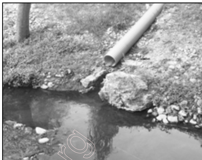
Гараднічанка мае каля 40 такіх «прытокаў»

Горадню рэканструюць: дзе можна і дзе няможна. Не прайшлі і паўз Гараднічанку. “Рэканструкцыя русла Гарадні-