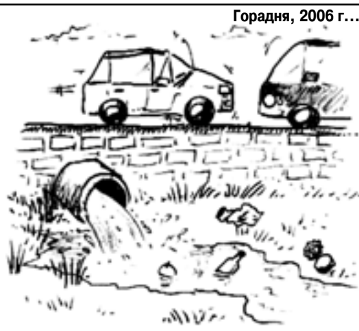
Горадня, 2006 г...