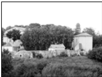
Стары замак Гародні чакае сваёй рэканструкцыі

Аб'яднанне "Гісторыка" плануе летнік. Ён адбудзецца 15 – 27 жніўня ў Любчы пад патранажам кіраўніка Фонду "Любчанскі замак" Івана Пячанскага. Мяркуецца пабудаваць паўтараметровы мур паміж дзвюма адноўленымі вежамі. Маецца зацверджаны праект і будматэрыялы, патрэбныя толькі рукі. Па інфармацыю звяртацца па тэлефонах: 755-03-70 і 654-65-59 (Зміцер).