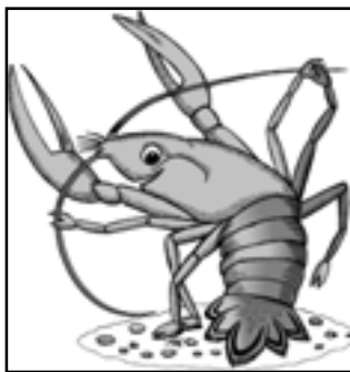
Не кожны чуе, як шэпчуцца ракі

Пасля заходу сонца, узрадаваныя сваёй здабычай, людзі вярталіся дамоў. І толькі адно не супысала: не