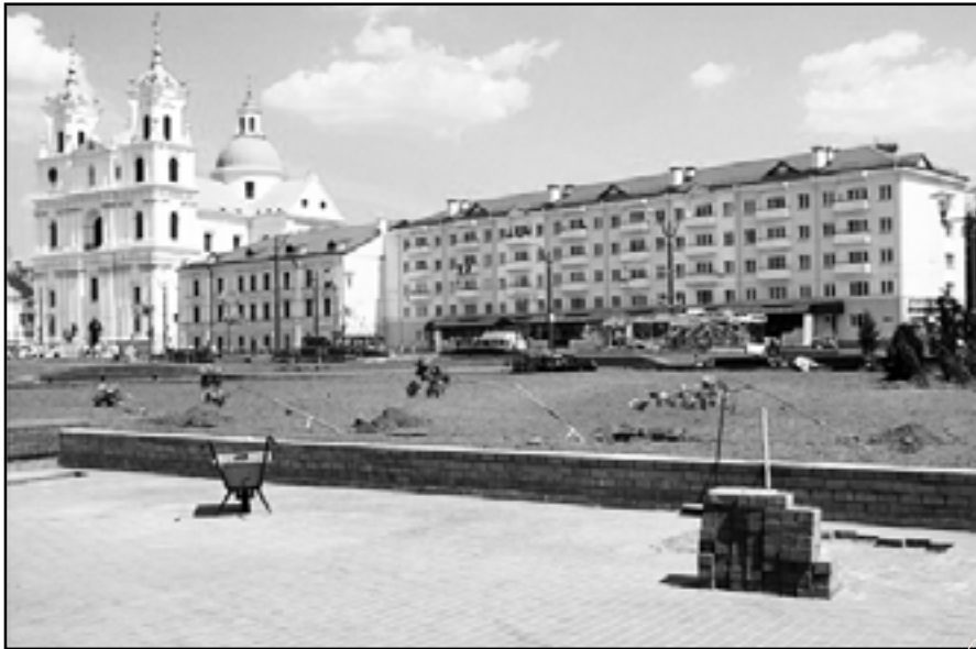
Вось так выглядае новы «сквер»

І што ж такога цэннага Вы бачыце ў гэтых дрэвах?» – шчыра здзівіўся супрацоўнік “Зелянстрою”.