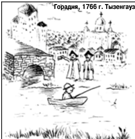
Горадня, 1766 г. Тызенгауз