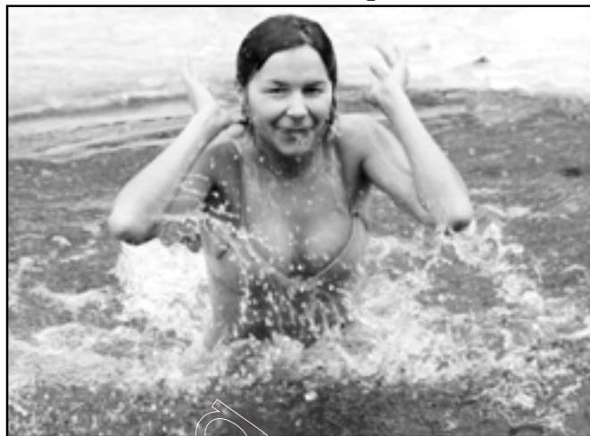
Хрышчэнская вада ачышчае душу і цела

- у якую апускалі левыя расліны, святаянскія (сабраныя на Купалле) зёлкі, вугальчыкі са сваёй печы, медныя, срэбныя ці залатыя манеты.