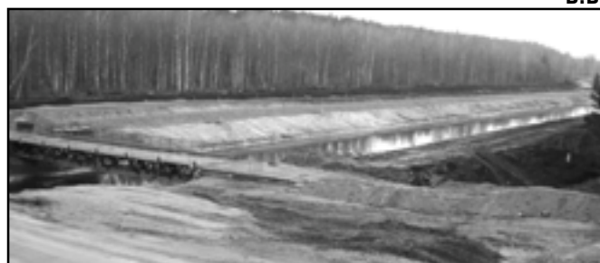
Адноўлены Аўгустоўскі канал

павінен сказаць: у Белавежскай пушчы ўжо