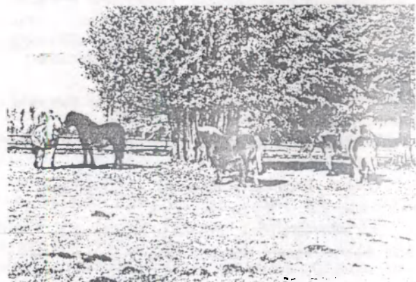
Коні спадара Мікалая Васілюка