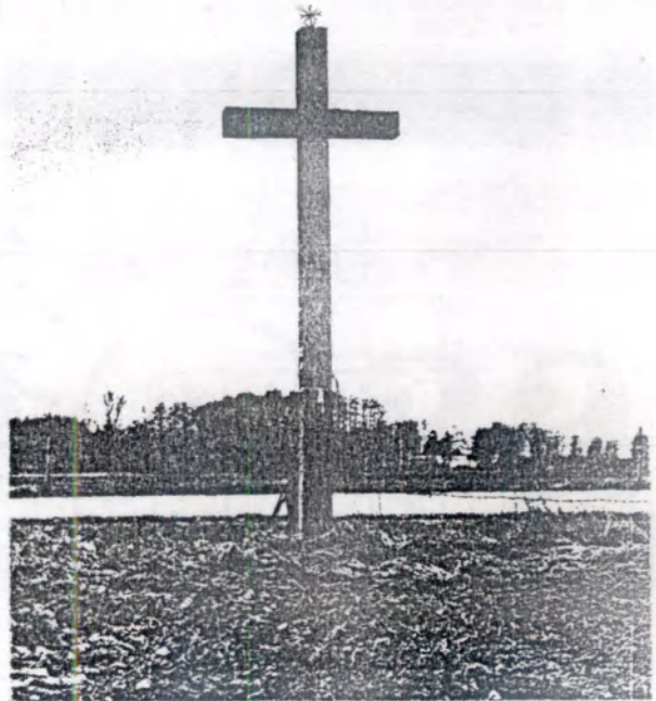
Памяць трагічных падзей