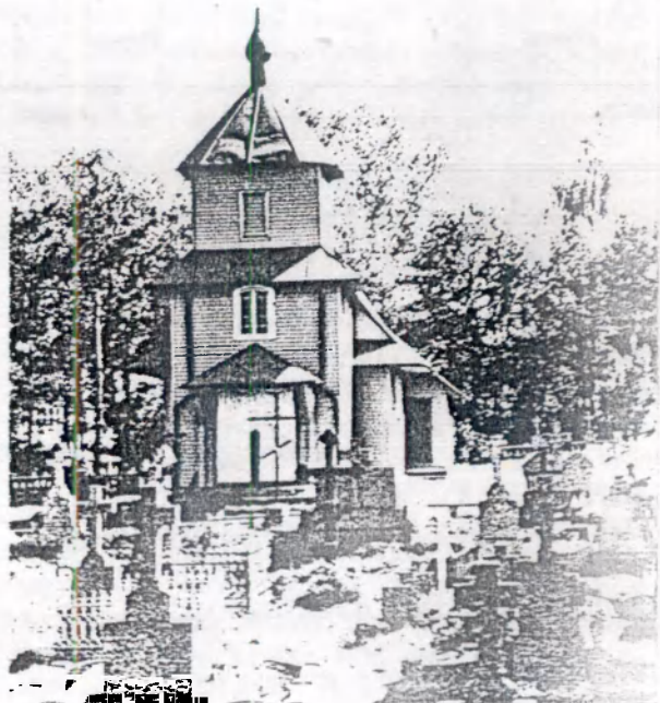
Царква ў Арэшкаве