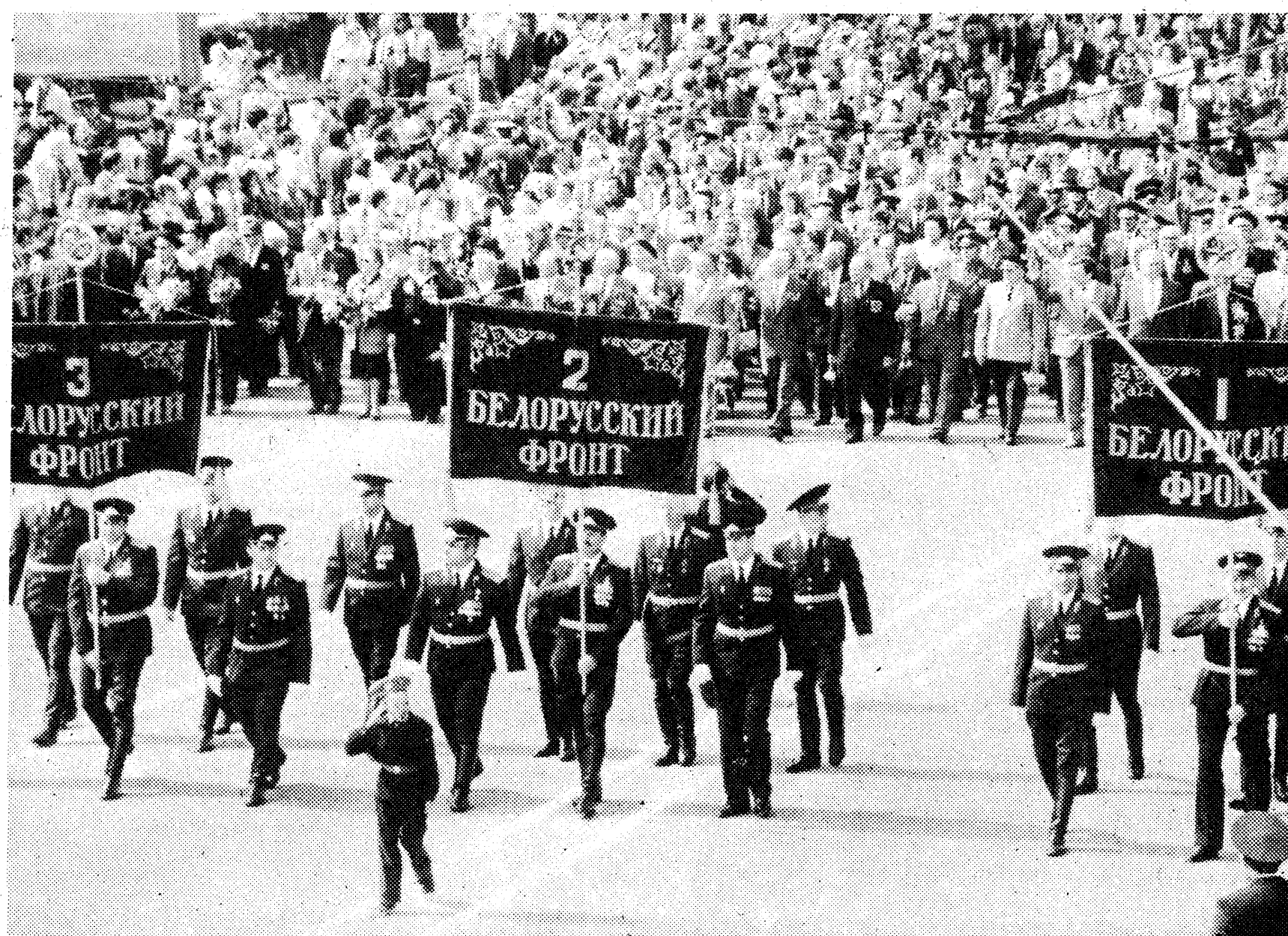
Праздник Победы. Минск, 9 мая 1993 года.